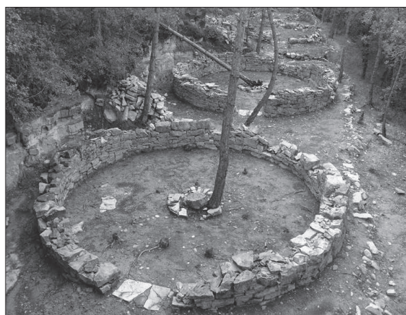
Figura 3. Conjunt de tendes còniques o del tipus suís documentades al campament militar de Pujalt.

Eren estructures circulars de 6,20 m de diàmetre, amb una base de pedra, d'altura aproximada d'1 m (per evitar l'entrada d'aigua a l'interior), amb una estructura circular al centre, de 1,10 m de diàmetre, on hi hauria un puntal de fusta que subjectava la lona que les cobria. Al voltant d'aquestes es van excavar un conjunt de canals per desviar l'aigua cap a terrasses inferiors.