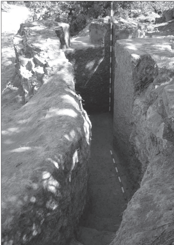
Figura 6. Niu de fuseller (àmbit 1) del conjunt defensiu de la L-2, al pas de Vallbona de les Monges.

S'hi accedia per dues boques d'accés –una a cada extrem de l'estructura– de les que només va ser volada parcialment la situada al nord.