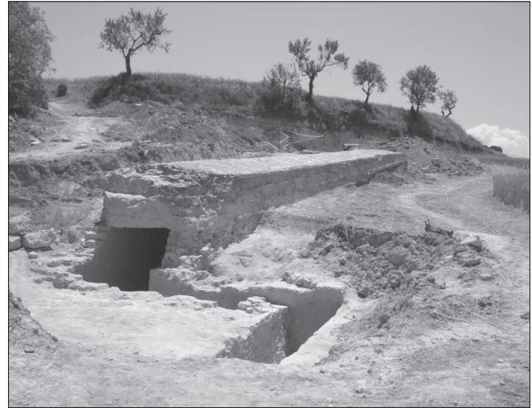
Figura 7. Refugi-trinxera (àmbit 2) del conjunt defensiu de la L-2, al pas de Vallbona de les Monges.

L'estructura té planta allargada, excepte a les boques d'accés on gira formant una petita galeria d'entrada a la galeria principal. Té unes mides de 23 m de llargada i una amplada interior d'1 m.