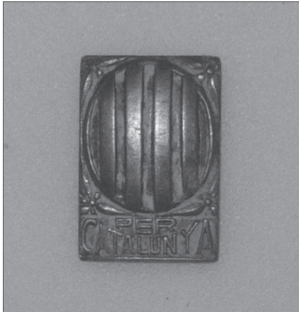
Figura 11. Insígnia metàl·lica amb l'escut de Catalunya on es pot llegir la llegenda "Per Catalunya".

Finalment, el grup més nombrós de troballes és la munició. S'han recuperat moltes bales i beines, bàsicament de fusells, i els carregadors del tipus de làmina o de molla que les contenien. Cal assenyalar també la recuperació de metralla de munició d'artilleria al Camp d'aviació d'Alfés 35 .