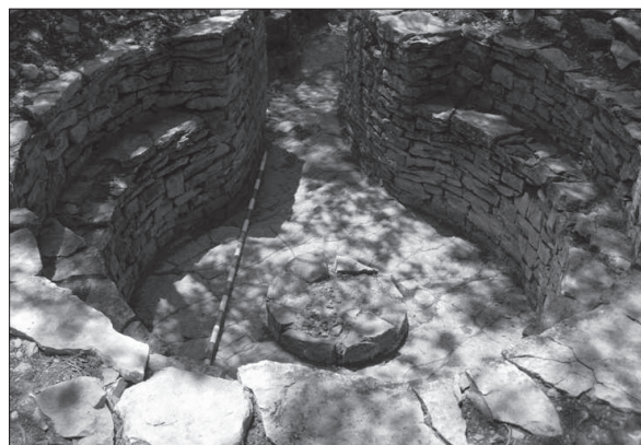
Figura 1. Emplaçament de la metralladora antiaèria documentada al jaciment del Campament militar de Pujalt (àmbit 1-C).

Al sud de l'emplaçament hi sortia una trinxera, de planta de ziga-zaga, excavada a la roca natural, que el connectava amb una casamata.