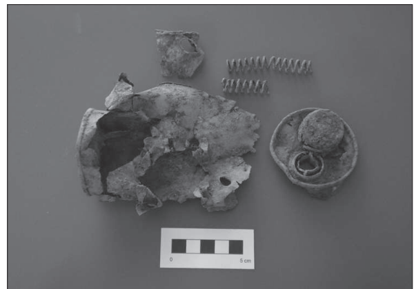
Figura 11. Restes d'una bomba de mà del tipus Lafitte .

De l'estudi de la munició recuperada s'extreu que mentre que dins del context republicà hi havia una gran varietat de fusells, dins del context nacional (Vilamur) s'ha trobat munició de tres tipus de fusells principals: el Mauser espanyol model 1893 de 7 x 57 mm de calibre; el carcano italià model 1891 de 6,5 x 52 mm de calibre i el famós Mauser k98 alemany calibre 7,92 x 54 mm de calibre.