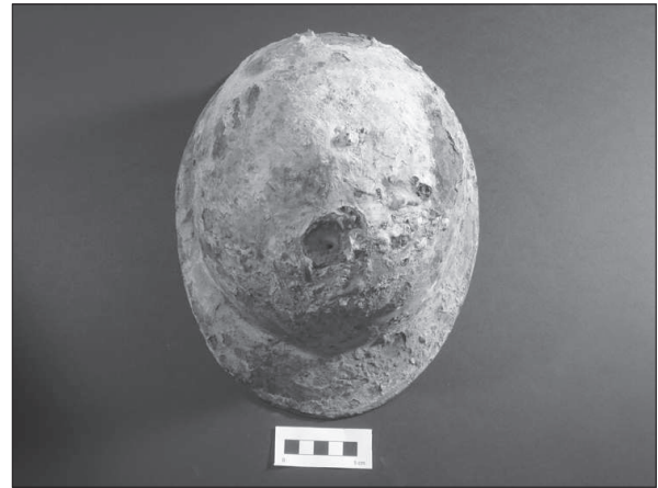
Figura 10. Casc model Adrian M-26.

Dins d'aquest punt cal destacar la troballa d'un casc francès model Adrian M-26 34 , localitzat al Camp d'aviació de l'Aranyó.