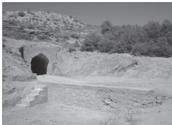
Figura 4. Sector 1 del camp d'aviació d'Alfés. Es pot observar l'entrada del polvorí i el moll de càrrega.

A la part inferior, recolzades en aquest mur es van documentar un escales fetes amb maons massissos, amb cinc esglaons; i un nivell de graves per on circulaven els camions. A la part superior hi havia la plataforma del moll de càrrega pròpiament dit, per on continuaven els negatius dels rails per on passava la vagoneta, fins on quedava frenada amb el topall.