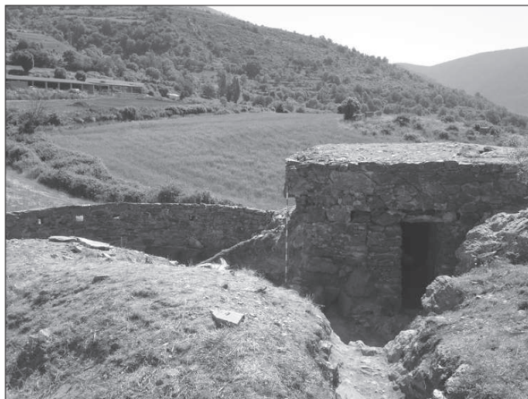
Figura 8. Conjunt defensiu de la Zona A, a Vilamur.