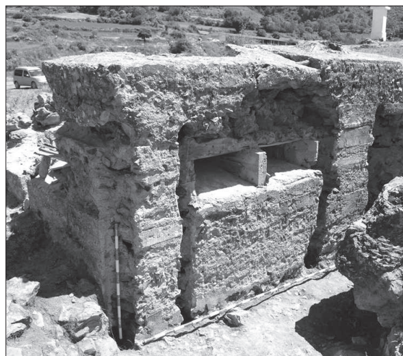
Figura 9. Casamata del conjunt defensiu de la Zona B, a Vilamur.

Entre els objectes quotidians i personals, s'han recuperat peces relacionades amb la higiene, com diferents fragments de miralls, una màquina d'afaitar, tubs de pasta dental i ampolles petites de colònies; objectes relacionats amb la correspondència dels soldats, entre els que destaquen la troballa de nombrosos tinters i alguna ploma estilogràfica; i alguna medicament (xarops) i revitalitzants –un d'ells de Cerebrino Mandri amb la llegenda " Cerebrino Mandri. Cura los dolores nerviosos y reumáticos "– i una caixa per posar