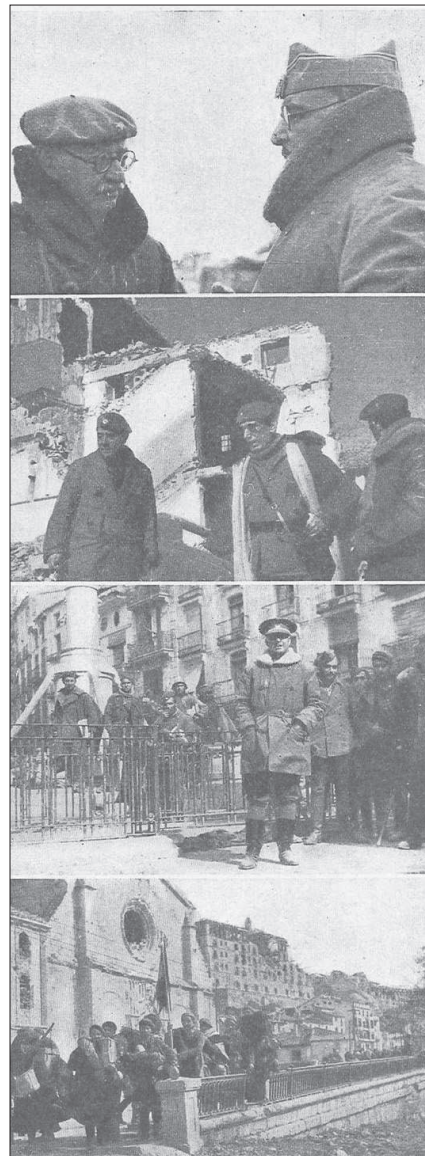
Figura 13. Mandos del ejército franquista entran en Teruel. ARRARÁS IRRIBAREN, J. SÁEZ DE TEJADA, C. 1984

El equipamiento, entre otros se prevé que disponga de un potente audiovisual. El ámbito audiovisual es, en el proyecto actual, una extensión natural del ámbito B, se plantea como una pro-