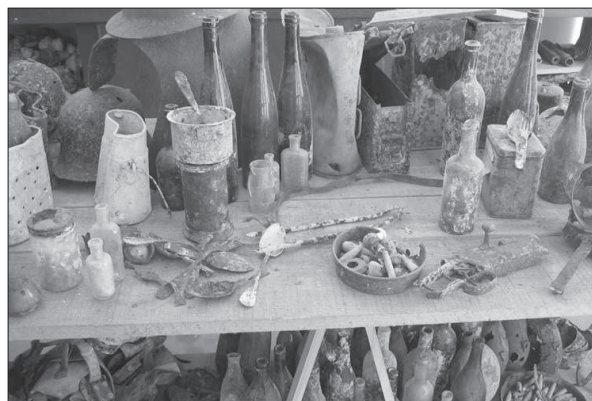
Figura 5. Bodegones con materiales arqueológicos, una manera de desmitificar las armas y la guerra, en el Memorial de la Gran Guerra (Peronne, Francia).