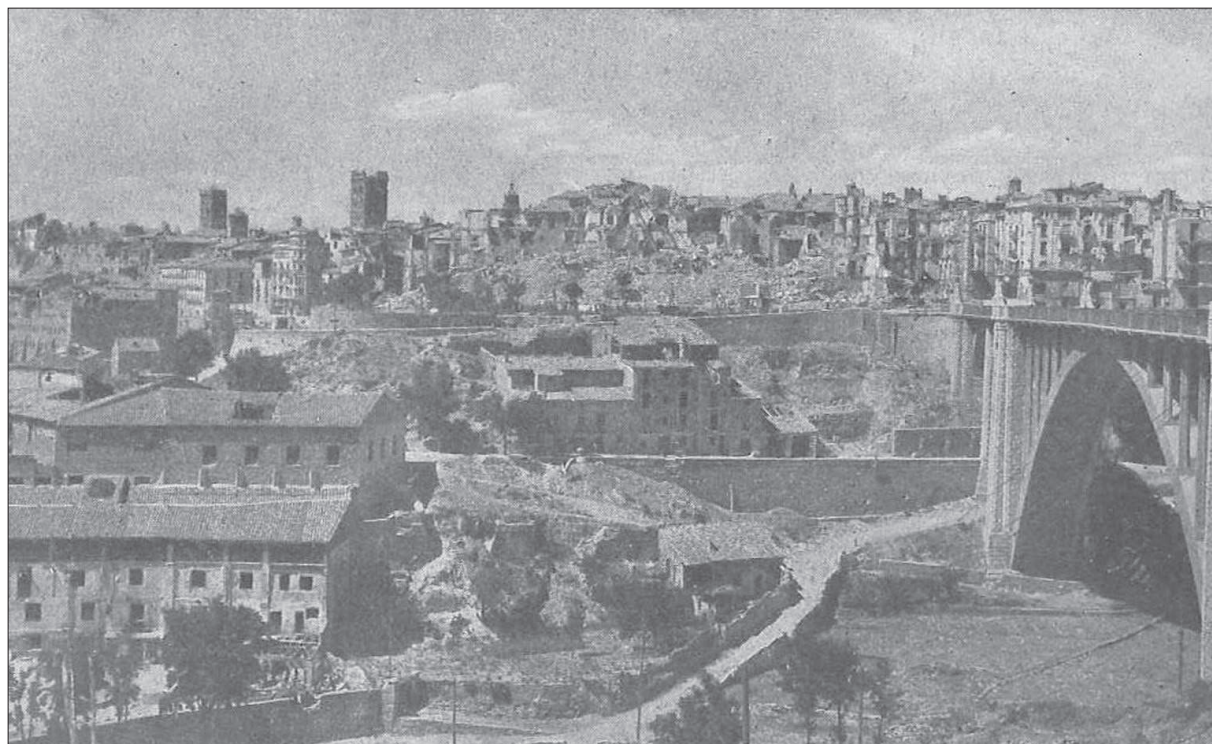
Figura 3. Vista general de la ciudad destruida.

ARRARÁS IRRIBAREN, J. SAEZ DE TEJADA, C. 1984