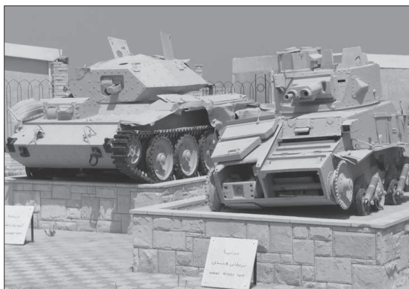
Figura 7. Material de combate de la segunda guerra mundial en el museo de El Alamein, en Túnez.