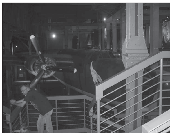
Figura 9. Museo de la Resistencia de Varsovia.