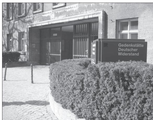
Figura 11. Memorial de la resistencia al nazismo de Berlín, ubicado en el antiguo cuartel general del ejército .

De todos los modelos analizados se desprende que el más interesante por su carácter holístico, por su voluntad innovadora y por el rigor de planteamientos tanto en lo que se refiere a los contenidos históricos como a las estrategias perimetrales de educación por la paz es el Memorial de Caen y, sobre todo, su exposición permanente. El centro cuenta además con una museografía espectacular. También se han tenido especialmente en cuenta las propuestas museográficas del Memorial de Omaha Beach. Finalmente considerar que la existencia de un modelo de éxito, que se sigue con cierta fidelidad, constituye un referente argumental contra cualquier intento de debate estéril sobre la oportunidad o carácter de este tipo de centros.