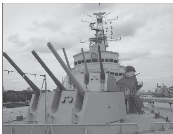
Figura 10. El Imperial War Museum de Londres; detalle del MHS Belfast.