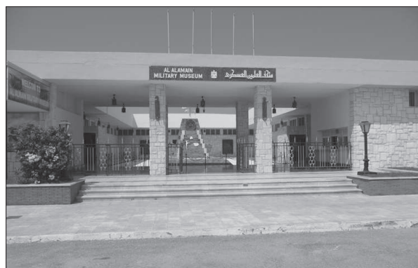
Figura 6. Museo de El Alamein en Túnez; el norte de África dispone de algunos museos que son memoriales de la II Guerra Mundial.