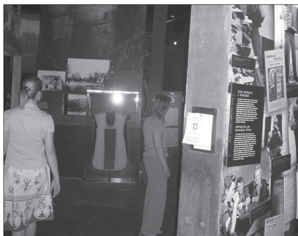
Figura 2. Vistas del interior del Memorial polaco, en Varsovia.

Los países que han sufrido conflictos bélicos como los que estamos comentando, tienen obviamente su Museo-memorial; Francia lo elevó en Verdún, Alemania en Berchtesgaden, pero ambos países han tratado su trágica historia contemporánea en sus grandes museos nacionales; en el caso alemán, en el impresionante Museo de Historia de Alemania en Berlín. El último país que ha construido su museo memorial ha sido Polonia, en un equipamiento sin precedentes en Europa instalado en una antigua fábrica, en lo que fue el ghetto de Varsovia. Otros países, como la Gran Bretaña ya incorporaron este tema en el Museo Imperial de la Guerra y en los últimos años del siglo XX le añadieron el gran equipamiento del búnker desde donde Churchill dirigió la Segunda Guerra Mundial, y que como es bien sabido ha sido una de las inversiones más suculentas en museografía de la capital del Reino Unido.