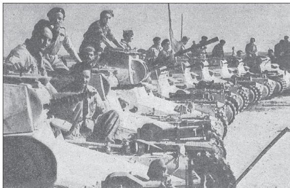
Figura 12. Fotografía de carros de combate franquistas frente a Teruel. ARRARÁS IRRIBAREN, J. SÁEZ DE TEJADA, C. 1984

Por el contrario, el ámbito B se centra en el desarrollo de la batalla de Teruel. Se trata de dar una visión holística del conflicto que ponga de relieve los grandes combates en el entorno de la ciudad y en su casco urbano y como las más diversas técnicas tecnológicas y armas del momento se pusieron en juego en un combate urbano y periurbano sin precedentes. Los contenidos se organizan a partir de los siguientes apartados: