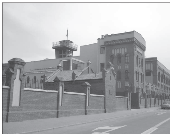
Figura 1. El Memorial de la Resistencia de Polonia contra el nazismo, en Varsovia.

España hoy no cuenta con ningún museo ni equipamiento dedicado a recordar su guerra, la del 1936-1939. No es que no existan pequeños memoriales; siempre los hubo, erigidos por los vencedores durante medio siglo y por los perdedores a principios del siglo XXI. Pero no estamos hablando de pequeños equipamientos construidos en escuelas en desuso de algunos pueblos ni de algunas museizaciones de búnkeres o de refugios para la defensa civil; estamos hablando de un Museo o Memorial de la Guerra Civil. Estas son pequeñas iniciativas encomiables, algunas de ellas quizás con presupuestos generosos, pero sigue faltando el equipamiento cultural que plantee la guerra como un gran conflicto general.