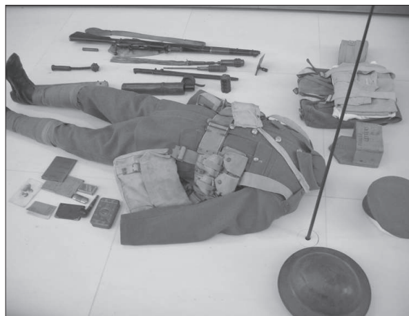
Figura 8. Historial de la Grande Guerre de Peronne.