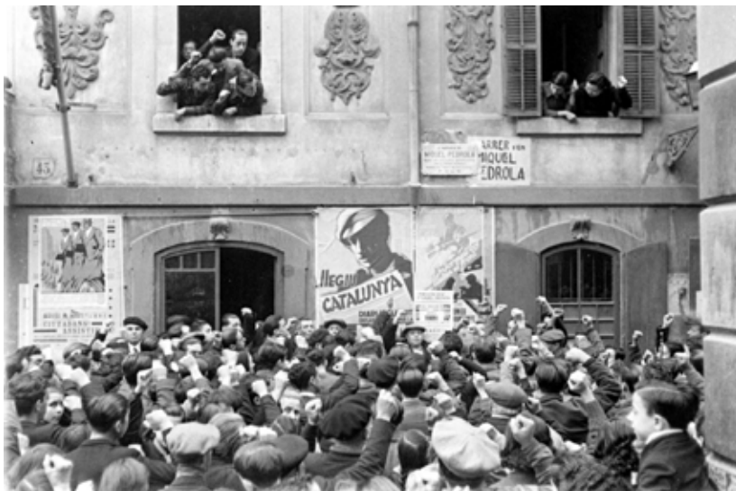
Figura 6: Descoberta d'una placa en honor a Pedrola l'any 1937.