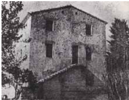
COLL ET AL., 1978

Figura 3: Molino Palacín de Casetas de Quicena (Coll et al., 1978).