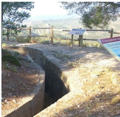
Figura 1. Trinxa d'observació vers l'Ebre