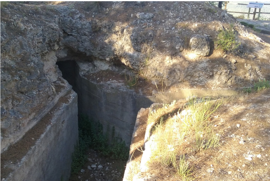
Fig. 3. Bifurcació vers passadís posterior o observatori.