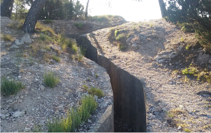
Fig. 2. Trinxera de sortida de l'observatori.