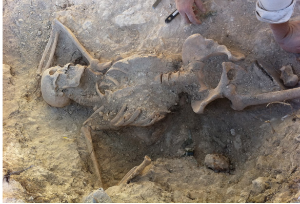
Figura 1. Excavació de l'esquelet Xarli, el 22 de setembre de 2011.