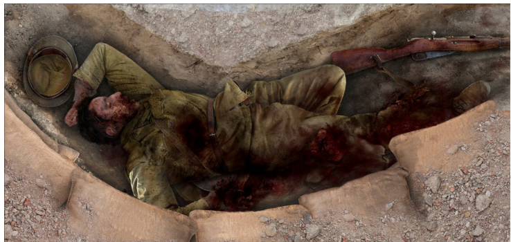
Figura 3. Recreació de la posició del soldat mort (M.H. Pongiluppi)