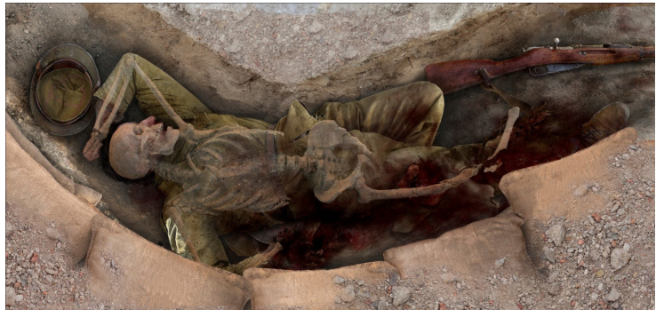
Figura 2. Conjunt de l'esquelet de Xarli.