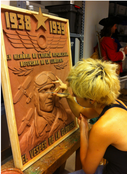
Figura 1: Procés d'elaboració de la placa dedicada a l'aviació republicana