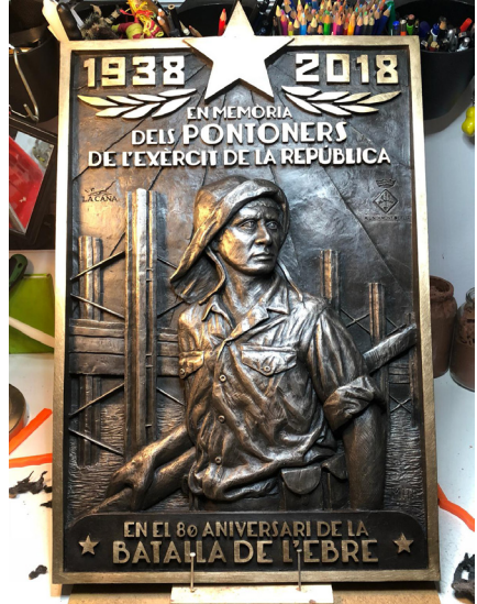
Figura 10: La Placa dels Pontoners de l'Exèrcit Popular ubicada al Castell de Flix