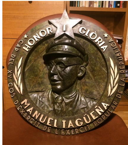
Figura 13: Placa del Tinent Coronel Manuel Tagüeña.