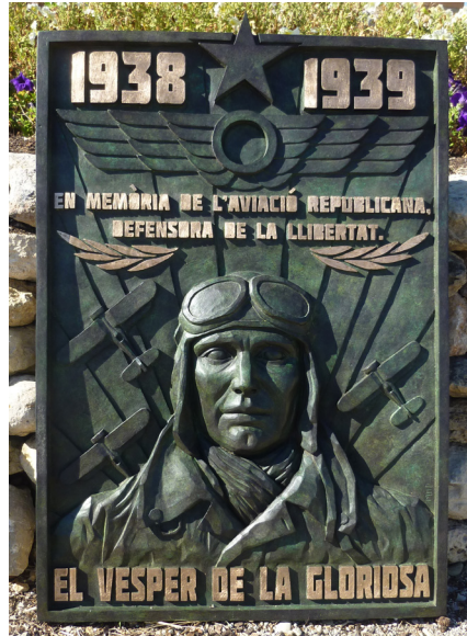
Figura 2: Placa dedicada a l'Aviació Republicana, abans de la seva instal·lació als Monjos

El motiu iconogràfic central ens presenta un grup de soldats en combat, El que està en primer terme porta un casc Adrian i està disparant un fusell Mosin Nagant; en segon terme un altre soldat, amb gorra de caserna, dispara un Màuser. En darrer terme un altre soldat amb casc Trubia està a punt de llençar una granada. Aquests elements estan en relació amb les restes trobades a l'excavació del 2011, testimonis d'una dura lluita, atès que es van localitzar desenes de beines de Mosin i de Màuser i nombroses granades defensives i ofensives. La placa escultòrica es va ubicar en una llosa de pedra, en una posició excessivament baixa que no acaba de permetre la seva contemplació. El conjunt està just al darrere de la trinxera excavada el 2011. El conjunt es va inaugurar el novembre de 2013 en un acte molt emotiu. Un grup de mossos d'esquadra, amb uniforme i equips del 1938, van retre guàrdia d'armes, i a la cerimònia van assistir el fill i familiars del General Rojo i el nebot del Tinent Coronel Mateo Merino, cap de la 35a Divisió Internacional. D'ençà del 2013 el lloc es va convertir en espai de pelegrinatge de memòria i se celebren anualment actes diversos commemoratius de l'exèrcit republicà i de la Batalla de l'Ebre.