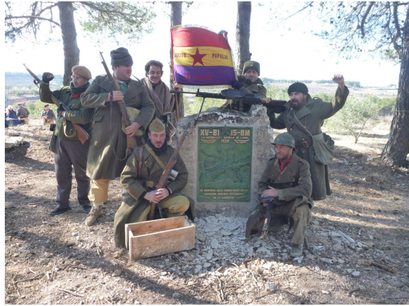
Figura 5: Grup de recreació històrica «Ejército del Ebro» a la placa de La Fatarella.