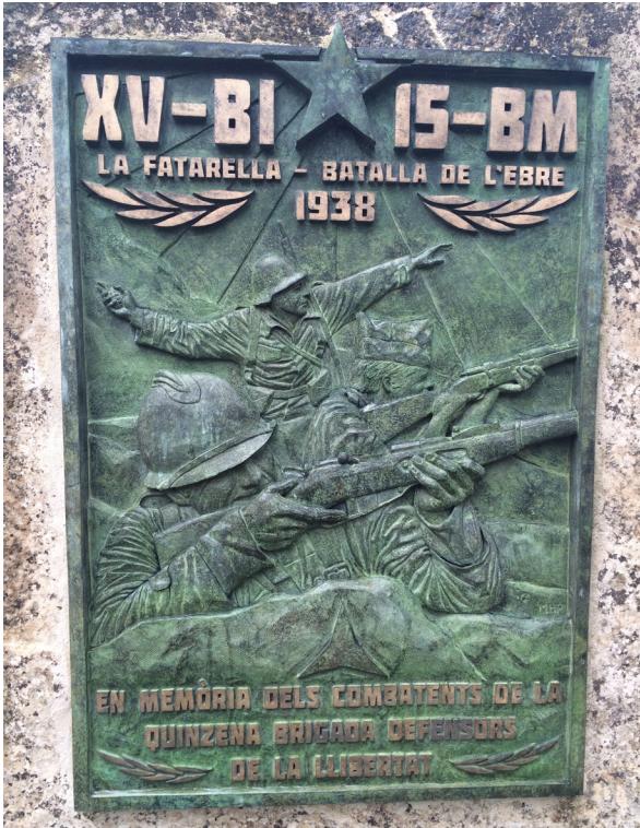
Figura 4: Placa de la XV BI – 15 BM a Raïmats, La Fatarella (Foto Mar H.P.).