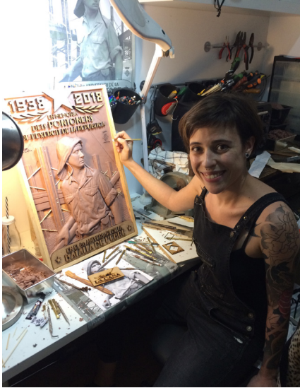
Figura 9: Elaboració de la placa dels pontoners