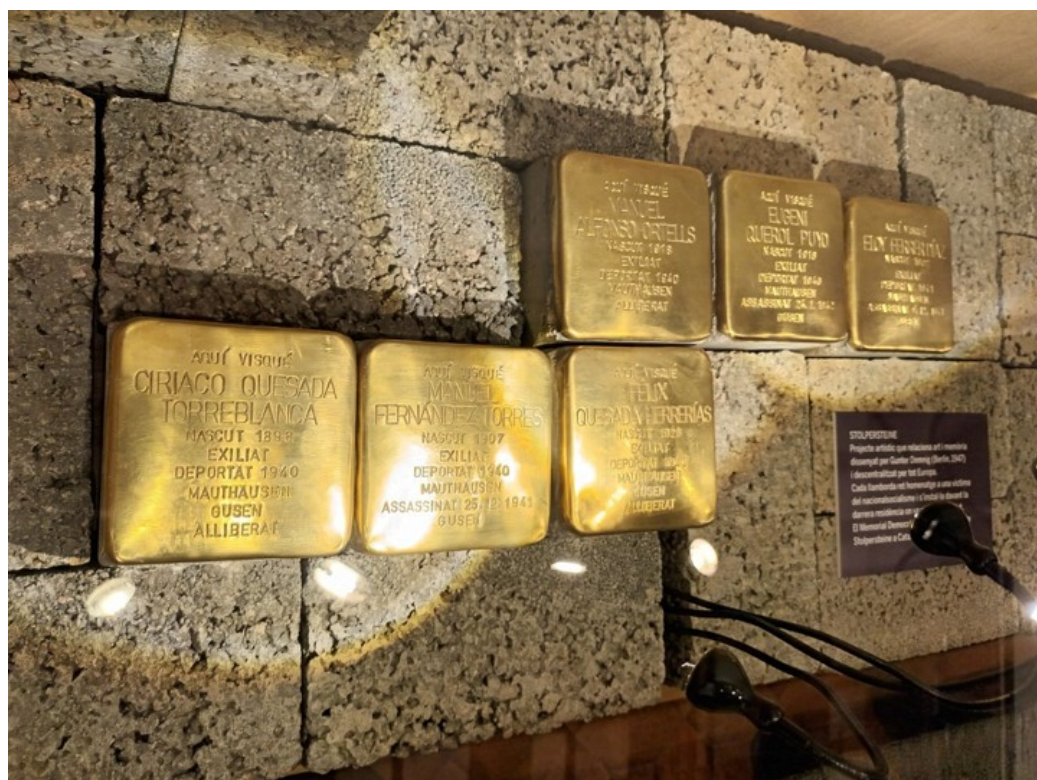
Figura 6. Fotografia de 6 de les 11 primeres stolpersteine pertanyents a deportats hospitalencs durant l'exposició sobre el tema que va tenir lloc entre març i juliol en el Museu de l'Hospitalet.

Des del tardofranquisme, l'Hospitalet de Llobregat s'ha caracteritzat per la seva lluita en la recuperació de la memòria històrica i democràtica, impulsada per la seva potent xarxa associativa. No obstant això, la història dels deportats de la ciutat i dels seus familiars va quedar en l'oblit durant diverses dècades, a l'ombra de les víctimes del franquisme.