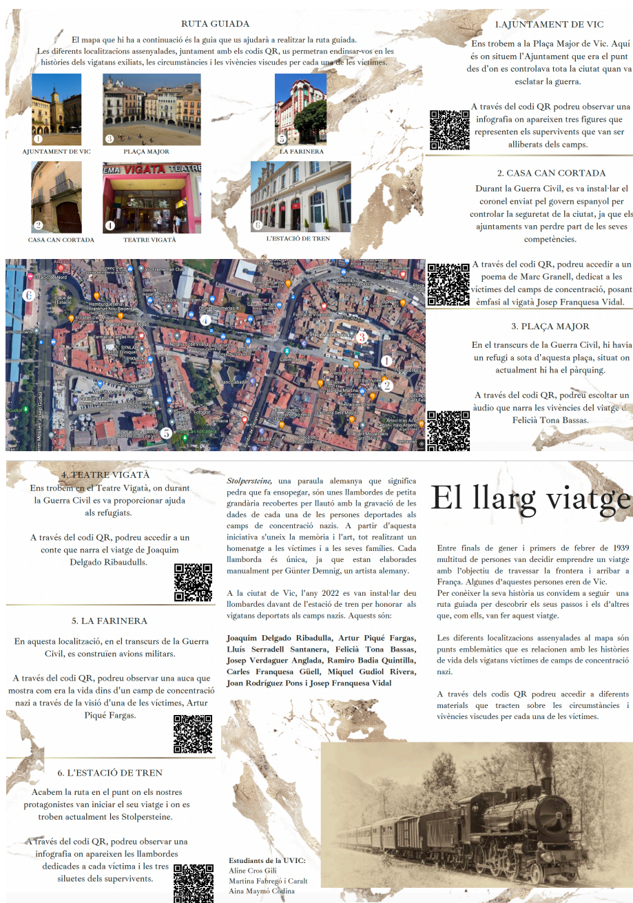
Imatge 2. Díptic repartit durant la visita.

Durant el recorregut hi ha un total de sis parades establertes i a cada una hi ha una activitat relacionada que permet poder parlar dels camps de concentració, de l'exili o de la supervivència dels deportats (vegeu Cros et al., consulta 29 de març de 2024). La primera parada és a l'ajuntament, on s'ensenya una infografia en la qual es veu els supervivents vigatans dels camps de concentració.