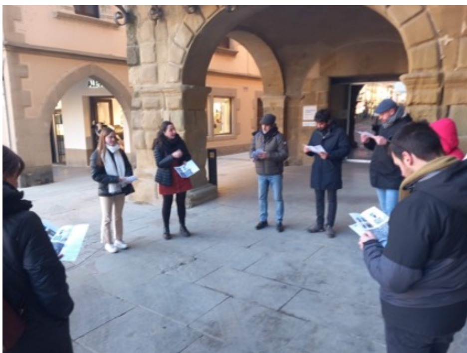
Imatge 3. Visita programada per l'Àrea de Cultura de l'ajuntament.

La proposta "El llarg viatge", per tant, representa no només una innovació en termes de contingut curricular, sinó també en la metodologia aplicada, posant l'accent en la necessitat d'una educació que reconegui i utilitzi el potencial del patrimoni cultural i històric com a eines per a l'aprenentatge significatiu i rellevant en el món contemporani.