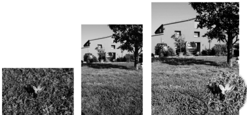
Figura 3 Una flor de safrà a can Pou de Riudellots de la Selva