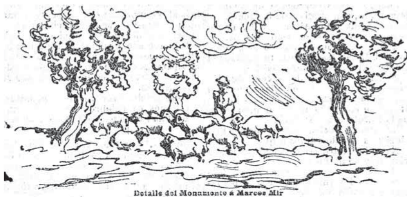
Figura 3: Detall del Monument a March Mir de Sant Sadurní d'Anoia que mostra un ramat de moltons tarragonins