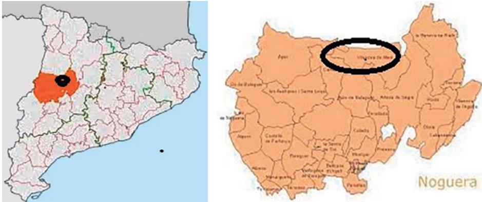
Mapa 1 Localització del priorat de Meià dintre del Principat de Catalunya en la comarca actual de la Noguera i una petita part al Pallars Jussà