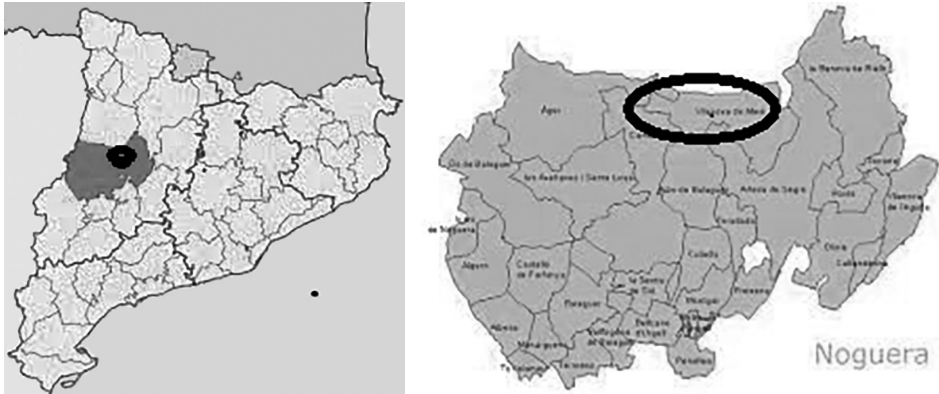
Mapa 1 Localització del priorat de Meià dintre del Principat de Catalunya en la comarca actual de la Noguera i una petita part al Pallars Jussà