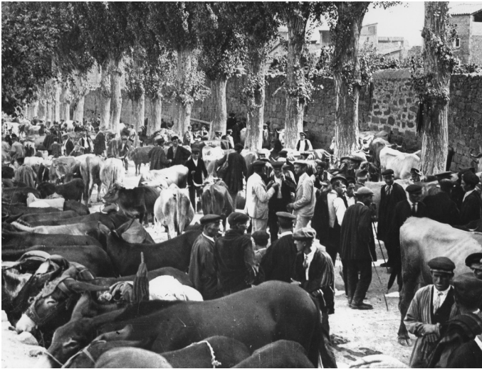
Figura 2 Fira al Vall Fred de Solsona el 1905