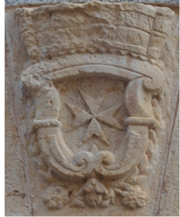
Figura 1 Escut del orde de l'Hospital al molí d'oli de Miravet

La vinya era un dels cultius majoritaris de la batllia i el delme sobre la verema o el vi és especificat en totes les poblacions. Els espais dedicats a la vinya eren desiguals i es diferenciaven dues zones dins de la senyoria: els termes propers al riu Ebre, on la seva presència era menor, i els territoris d'interior, on el seu cultiu tenia un pes major. Una diferenciació acusada per la pròpia formació geogràfica dels diferents termes i que es va establir durant segles, com mostren les diferències esmentades en les formes de delmar. 105 Al segle XVIII l'expansió de la vinya va ser general a tota la batllia, vinculada especialment a la producció i comercialització de l'aiguardent. Les terres dedicades a la vinya arribaren a representar un 20 % o més de l'espai conreat en aquesta centúria. Són valors pròxims a zones on la vinya es va anar expandint a l'època moderna, 106 però lluny dels espais on va arribar a ser majoritària. 107 En algunes zones de l'interior la vinya va arribar a superar els espais dedicats a l'olivera. En els termes propers a l'Ebre els valors eren més baixos, menys a les terres mensals, on els arrendadors donaven un pes destacat a la vinya pel seu interès comercial.