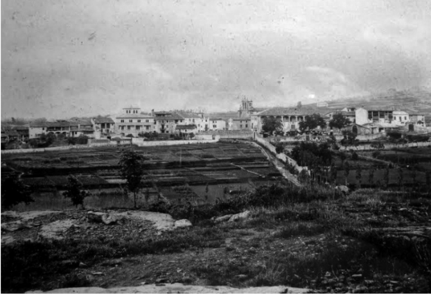
Vista general de Folgueroles amb un sector dels horts, la masia de la Sala i l'església al seu darrere al començament del segle xx.