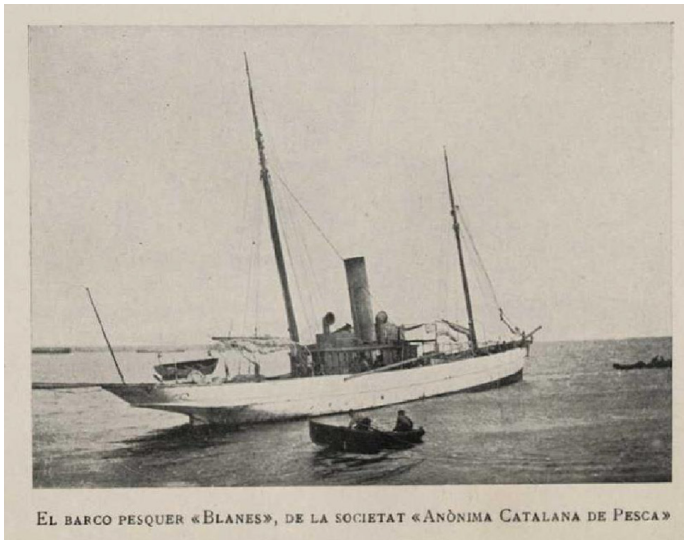
Figura 1 Vapor Blanes