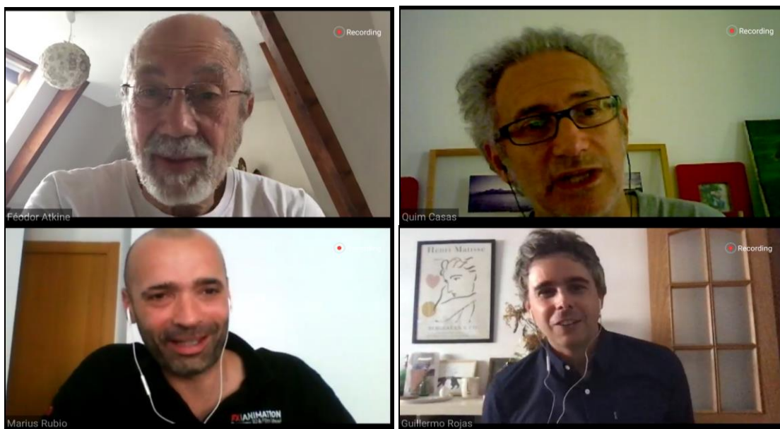
Participantes en la mesa redonda telemática Centenario de Éric Rohmer: Amor y desamor naturalista