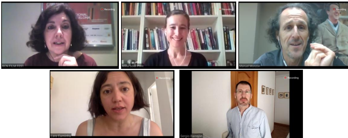
Participantes en la mesa redonda telemática “LAAB: Reinicio en la actividad del cine, intercambio de derechos, producción, distribución y exhibición. ¿Nuevos hábitos, nuevos paradigmas?”.