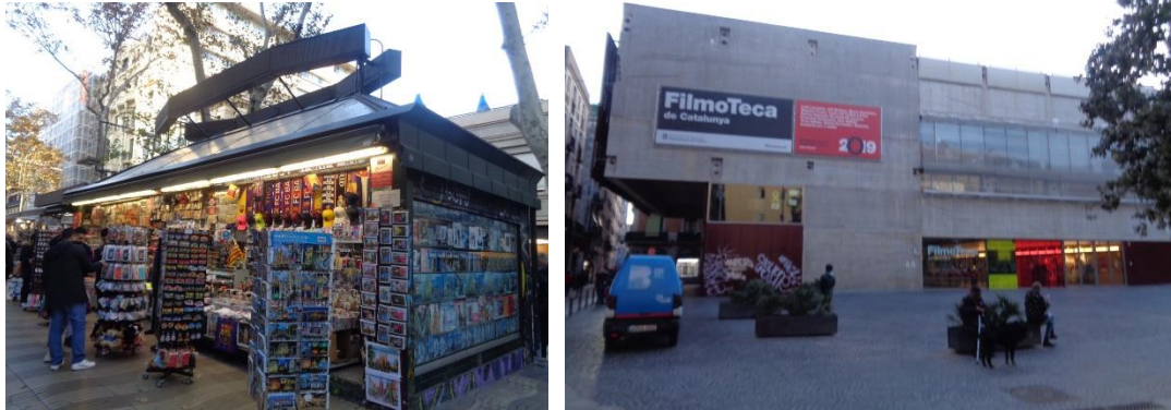
Kiosko de las Ramblas de Barcelona ( esq.) Fachada de la Filmoteca de Catalunya ( dcha.).