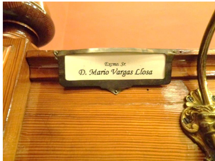
Tarjeta de Vargas Llosa en la Academia de la Lengua. Madrid.

El texto aquí presentado trata un tema sugestivo, pero no muy abordado a nivel teórico. Abarca la trayectoria de MVLL como espectador de cine, desde las primeras proyecciones acompañado de su madre hasta su posterior afición a los westerns de John Ford y su predilección por realizadores como Luis Buñuel (con quien comparte su común vivencia en América Latina), David Lean (director de obras tan destacables como El puente sobre el río Kwai , Lawrence de Arabia , Doctor Zhivago , La hija de Ryan o Pasaje a la India ) y otros. Por cierto, el autor de Conversación en La Catedral (de quien se pueden observar rasgos propios en la película Tinta roja de Francisco Lombardi) aborda el estudio de la novela de Boris Pasternak en su obra La verdad de las mentiras . Se trata de una novela destacable del antes poeta Boris Pasternak, que dio lugar a una fuerte polémica cuando se publicó en el contexto de la Guerra Fría. La versión del británico David Lean debió complacer a MVLL, aunque no lo diga explícitamente.