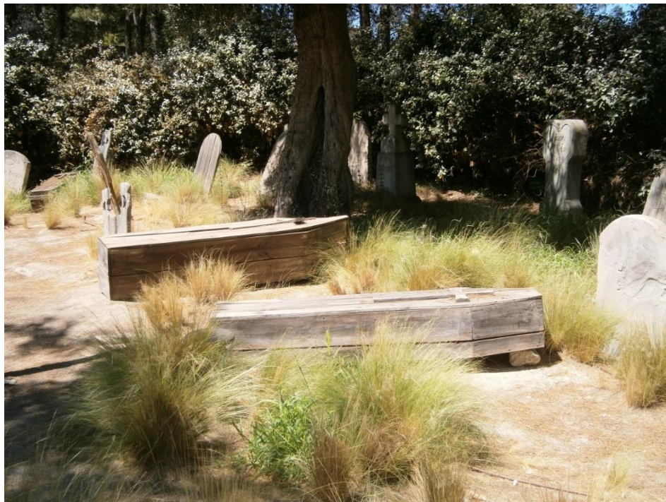
Ataúdes de madera. Parque Wagner de Madrid