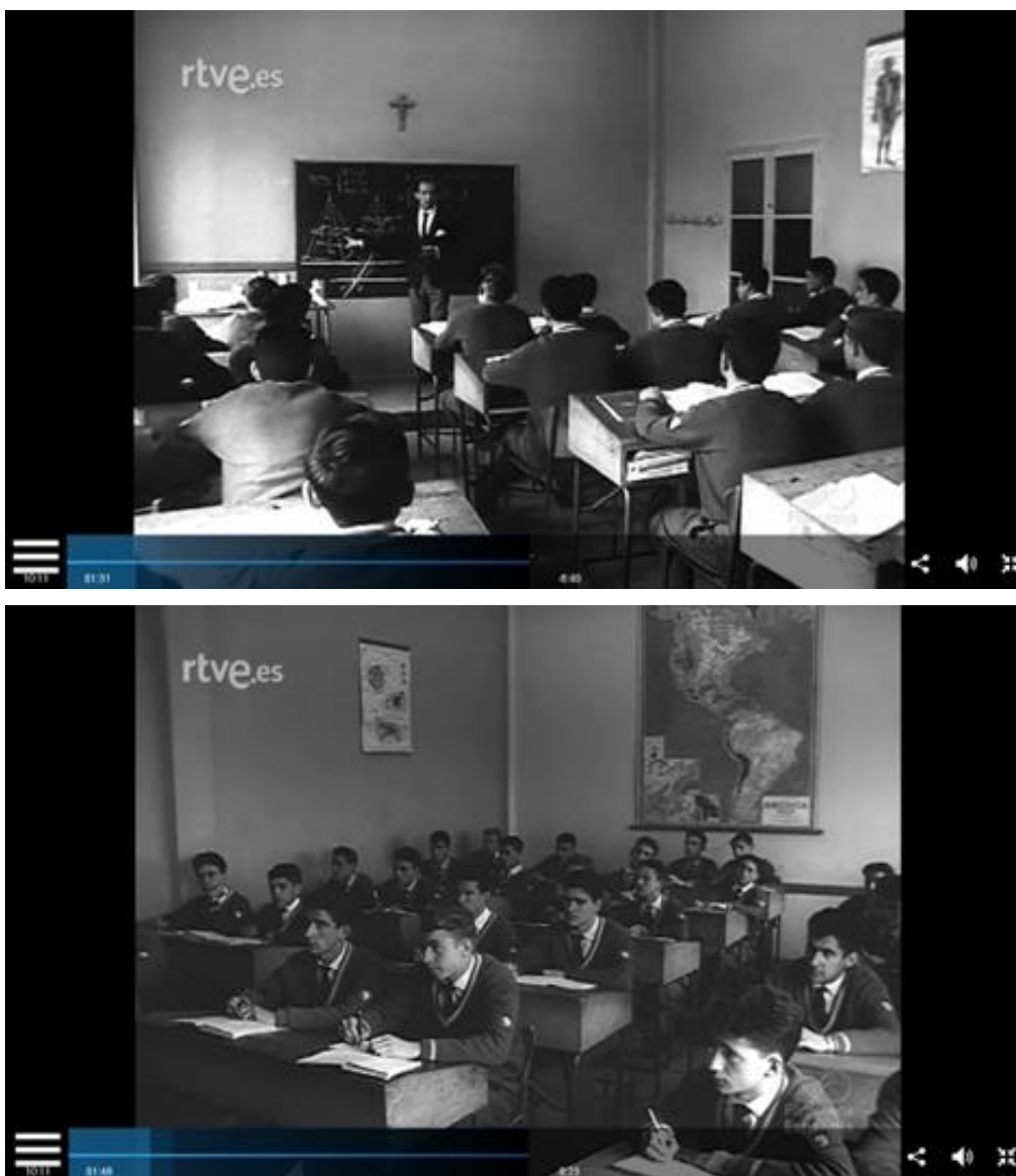
Figura nº 7: Alumnos del Colegio Menor Santa María del Lidón (Castellón) en clase de geometría.

Aragón, Lérida). Franco fue el encargado de presidir este acto y los alumnos del colegio lo recibieron colocados en filas y en posición de formación. Otro noticiario 34 y un Documental en Blanco y Negro 35 presentaron las mismas imágenes y locución para informar sobre la inauguración del Colegio Menor Santa María de la Rábida del Frente de Juventudes (Huelva), con capacidad para doscientos alumnos en régimen de internado. Franco fue el encargado de presidir el acto y, acompañado por otras autoridades, fue recibido en un patio interior por todo el personal del colegio, incluidos los alumnos que iban vestidos con el uniforme de paseo y estaban colocados en filas y en posición de formación.