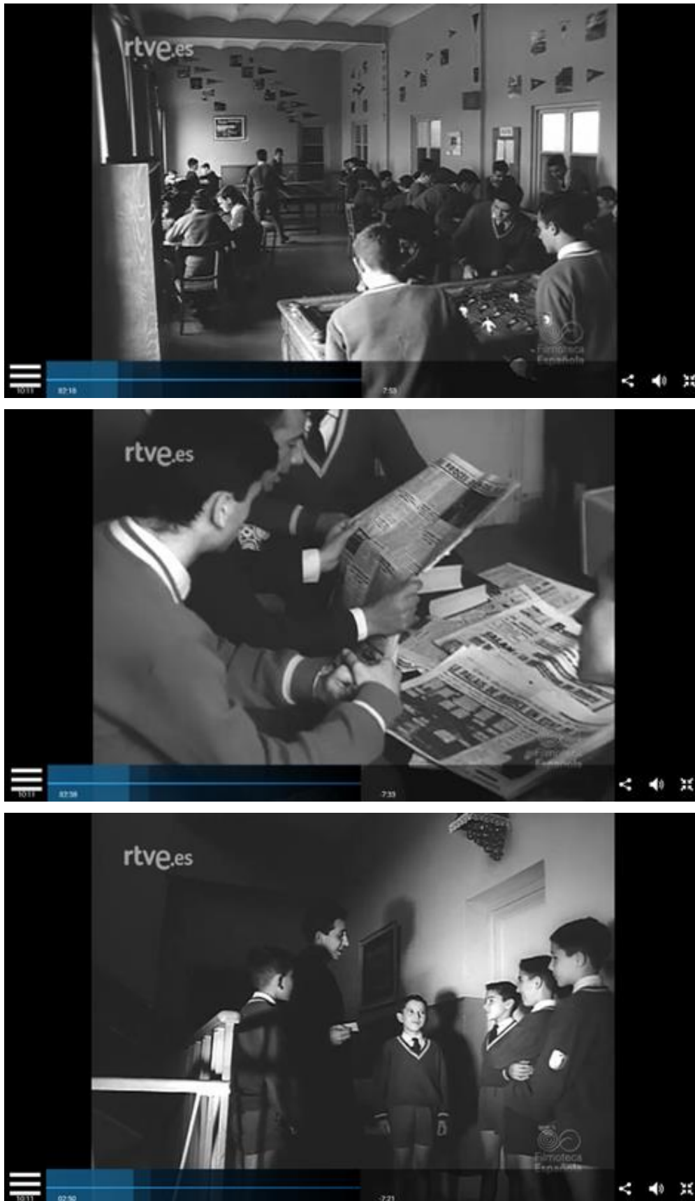
Figura nº 8: Alumnos del Colegio Menor Santa María del Lidón (Castellón).