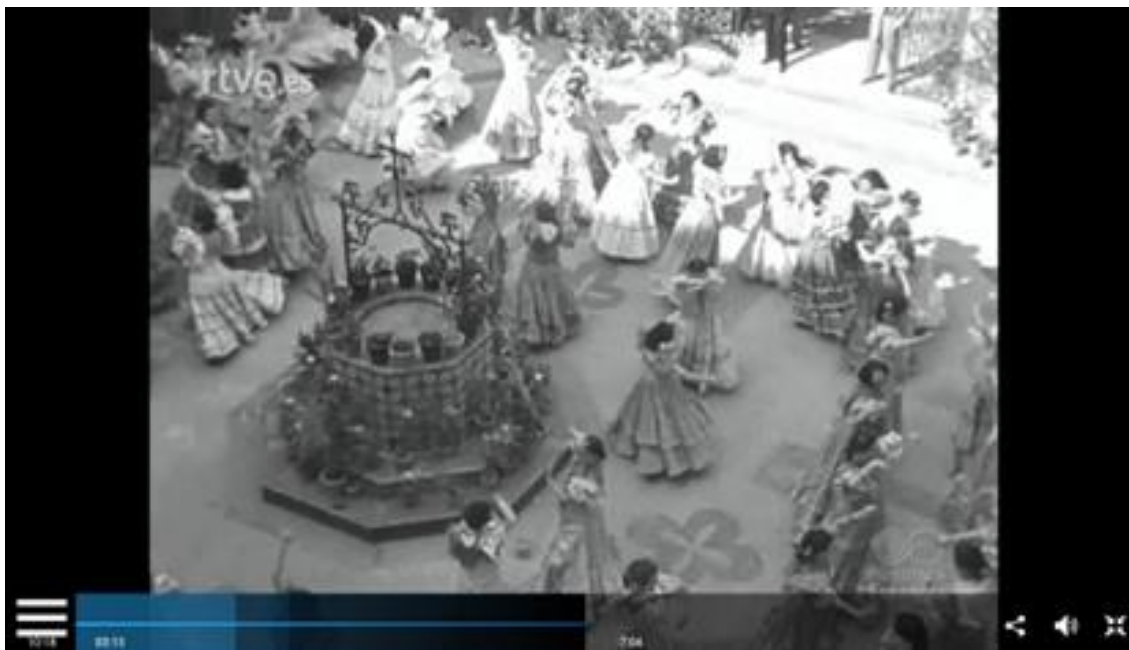
Figura nº 3: Ministro de Educación visitando el Instituto femenino de Enseñanza Media Murillo (Sevilla); y alumnas realizando una exhibición de sevillanas.

De los siete números emitidos en este primer periodo, cuatro se corresponden con inauguraciones o nuevas construcciones de institutos de Enseñanza Media. Así, el Noticiario 175 B 10 (sin sonido) informó sobre la visita de Franco al Instituto Nacional de Enseñanza Media (masculino) de Cartagena para inaugurarlo. El jefe del Estado, acompañado por diversas autoridades, recorrió las dependencias del colegio: aulas donde había pupitres para dos alumnos, pizarra, crucifijo, mesa y silla del profesor, retratos y un mapa de América del Norte (ver Figura nº 4); comedor; aula de dibujo; laboratorio; patio; y piscina. Otra inauguración transmitida por NO-DO 11 fue la del Instituto Nacional de Enseñanza Media Alfonso VIII (Cuenca). El encargado de presidir el acto fue el ministro de Educación Nacional, Ibáñez Martín. El ministro, junto con otras autoridades y el claustro docente, recorrió las dependencias del centro, y asistió a una exhibición de gimnasia rítmica ejecutada por las alumnas de los tres primeros cursos. El instituto era mixto. El Noticiario 248 A 12 (sin sonido) transmitió otra inauguración, en este caso la del Instituto de Enseñanza Media (masculino) de La Coruña. Las imágenes mostraron a Franco, acompañado por otras autoridades y por el claustro del centro, visitando las diferentes dependencias del edificio: capilla; aulas