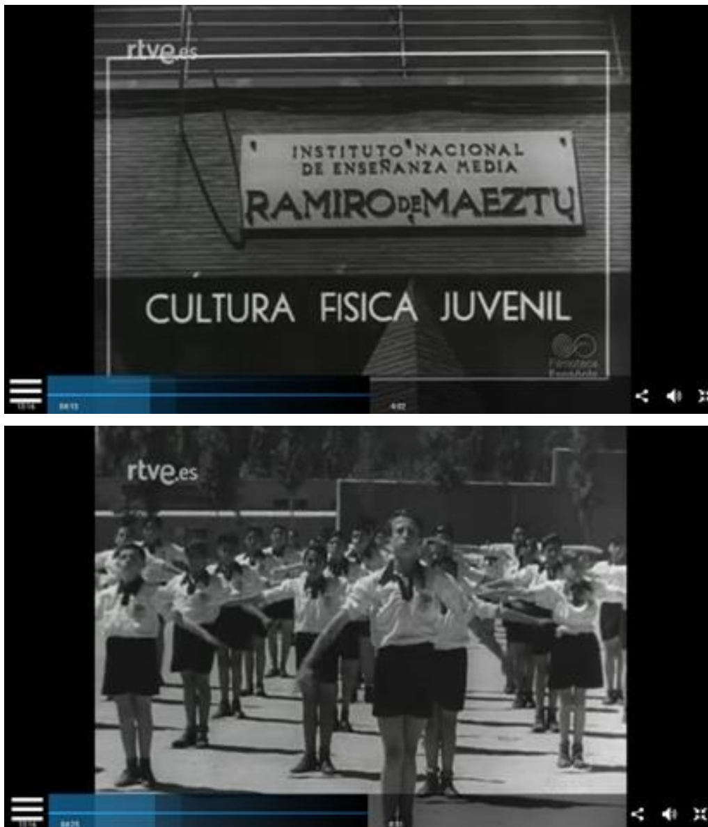
Figura nº 1: Alumnos del Instituto Ramiro de Maeztu en una exhibición de gimnasia.

relieve” (Lorenzo Vicente, 1998: 80). El Anteproyecto de 1947 fue elaborado por el Ministerio de Educación Nacional y supuso “un avance considerable respecto a la situación existente, tanto en lo referente a la propia estructura que se daba al Bachillerato [...] y, desde luego, con el profesorado”, aunque este proyecto no llegó a salir a delante (Lorenzo Vicente, 1998: 85). En la Ley de 1938 solo se estableció el Bachillerato Universitario, pero el Anteproyecto sí hizo mención a un Bachillerato científico-técnico en igualdad con el clásico y el científico. En 1949 se promulgó la Ley de Enseñanza Media y Profesional que creó el Bachillerato Técnico y Laboral, pero sin alcanzar la igualdad establecida en el Anteproyecto. A continuación, se van a analizar siete de los 21 números sobre el Bachillerato que fueron emitidos entre 1943 y 1951 en NO-DO, es decir, con la Ley de 1938 en vigor.