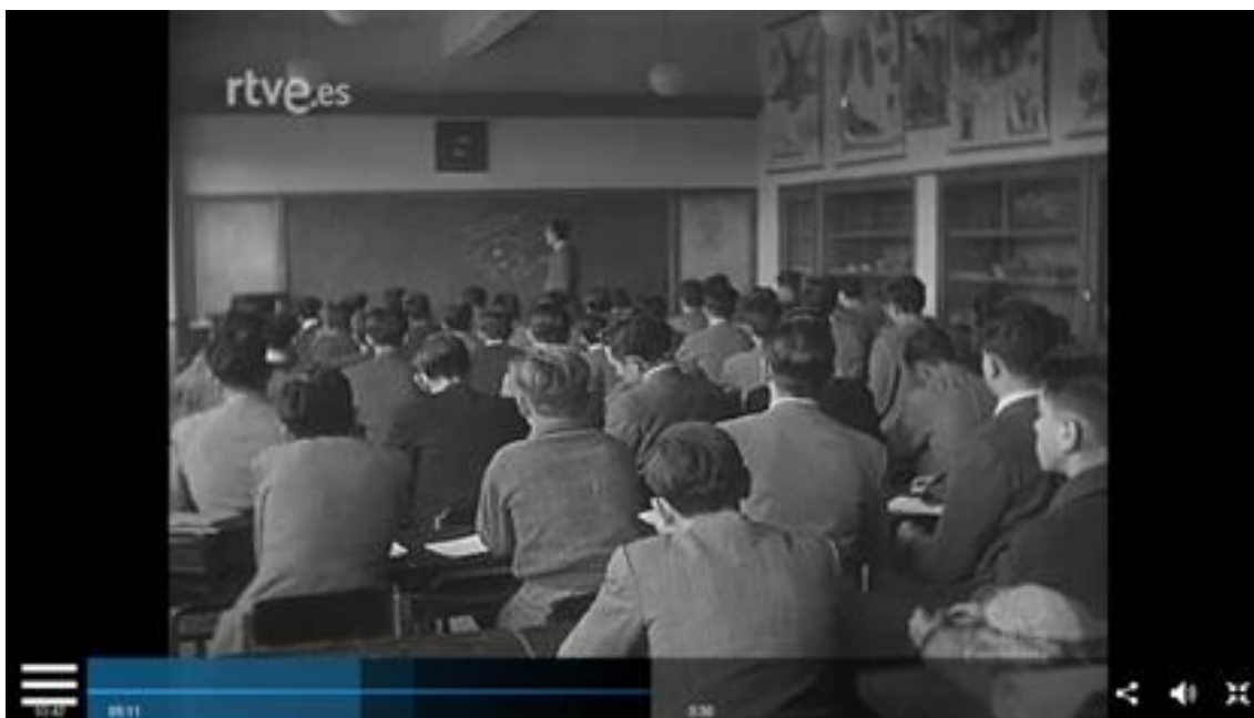
Figura nº 2: Alumnos del Instituto Ramiro de Maeztu.

El Noticiero 440 B 9 (sin sonido) mostró la visita del ministro de Educación Nacional, Ibañez Martín, al Instituto Femenino de Enseñanza Media Murillo (Sevilla). El ministro, acompañado por otras autoridades, visitó el centro y presenció una exhibición de sevillanas (ver Figura nº 3). Las alumnas iban ataviadas con trajes de gitana y tocaban las castañuelas.