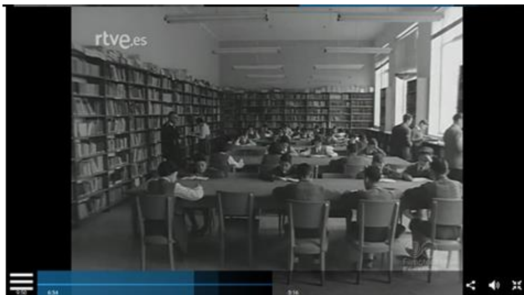
Figura nº 5: Aulas de niñas y de niños y biblioteca del Instituto de Segunda Enseñanza de Ceuta.