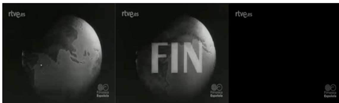
Figura nº 6. Cierre del noticiario del NO-DO nº 926 A/B/C, del 3 de octubre de 1960.