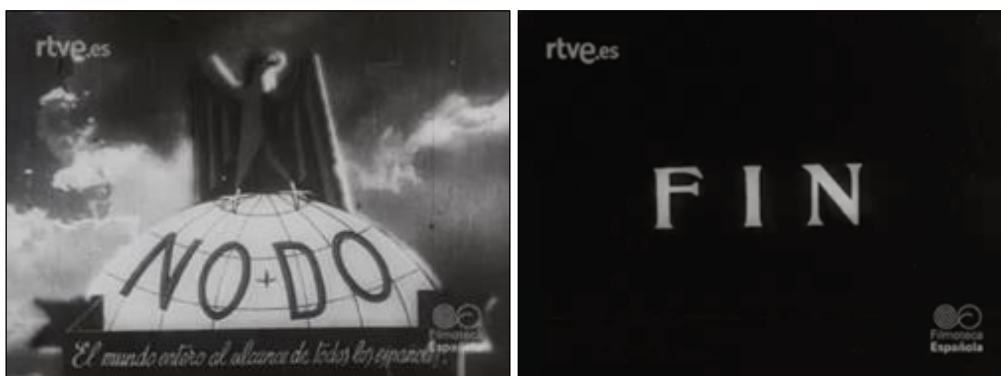
Figura nº 3. Distintos fotogramas del cierre del noticiario del NO-DO nº 1, del 4 de enero de 1943.