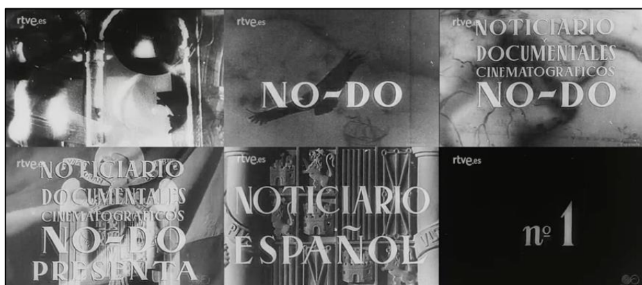
Figura nº 2. Distintos fotogramas (planos nºs 1-6 en sentido horizontal) de la cabecera del noticiario del NO-DO nº 1, del 4 de enero de 1943.

Bajo este contexto social, político y cultural autárquico al que nos hemos referido con anterioridad y que marca, de algún modo, el primer periodo «sonoro» de los noticiarios del NO-DO, se desarrolla una producción cinematográfica que abarca desde la inauguración del noticiario nº 1 un 4 de enero de 1943 hasta el noticiario nº 925 A/B 9 del 26 de septiembre de 1960.