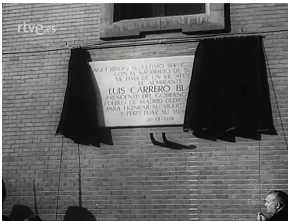
Figura nº 7: Placa en memoria de Carrero Blanco en el lugar del atentado.

Lo que bajo otro régimen hubiese constituido una alteración profunda de todo un sistema -añadió luego-, en nosotros sirvió para robustecer nuestros ideales y unir a los españoles para su cerrada defensa 27 .