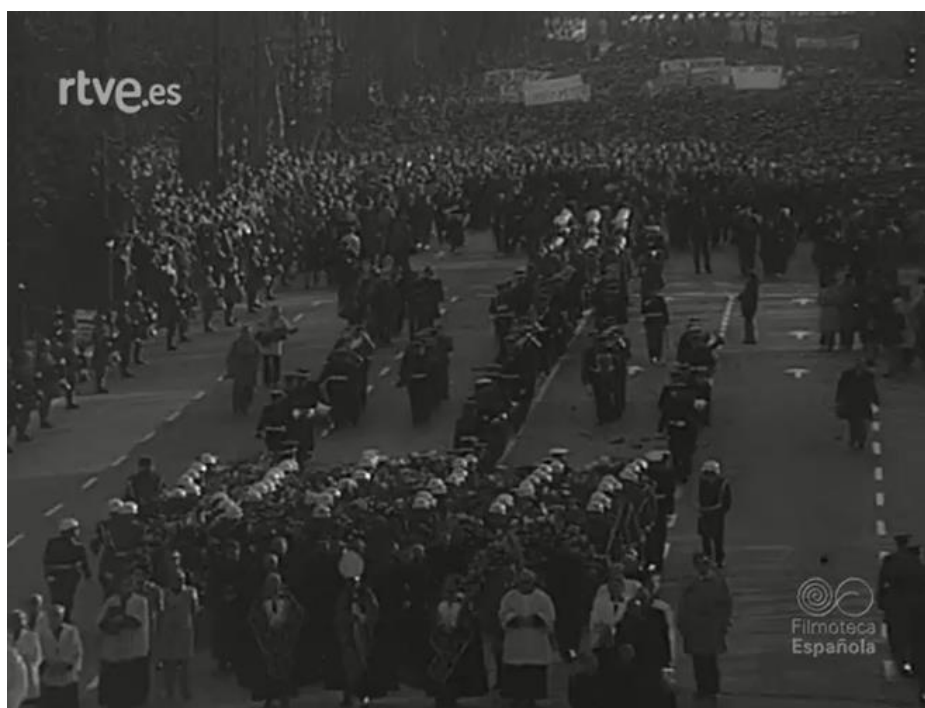
Figura nº 6: Sepelio de Carrero Blanco atravesando el Paseo de la Castellana de Madrid.

En la imagen (Figura nº 5) no se puede apreciar el deterioro del dictador, pero en el vídeo del NO-DO sí que es palpable esa debilidad física y visual que no quería enseñar el núcleo duro del franquismo ni tampoco el propio Franco. Además, hay un claro y constante contraste con la figura del príncipe Juan Carlos, que destaca por su físico entre los envejecidos miembros del gobierno tal y como se puede observar en el consejo de ministros justo antes de dar paso al sepelio del almirante.