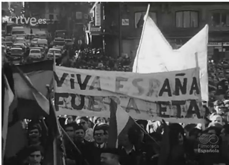
Figura nº 2: Pancartas de la jornada de exaltación patriótica.

Como se puede observar en las dos imágenes (Figura nº1 y Figura nº 2), en la noticia se muestran el palco de autoridades (en el punto de fuga de la imagen), los manifestantes cantando el Cara al Sol y mostrando pancartas con lemas como: “Fuera el anarquismo”, “Viva España” o “Fuera ETA” 17 . El objetivo es evidente: enseñar al mundo el apoyo popular a favor del Caudillo.