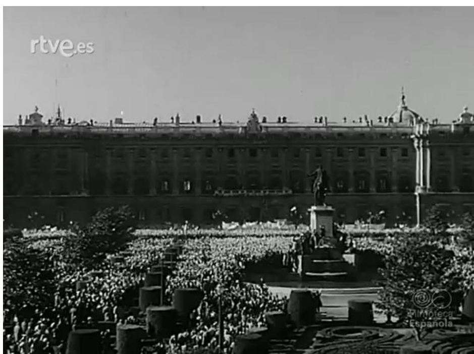
Figura nº 1: Manifestación patriótica en la Plaza de Oriente de Madrid.

En el convento de la Encarnación de Madrid tuvo lugar un funeral por las víctimas del terrorismo de la ETA; al final del cual se concentraron frente a la iglesia miles y miles de madrileños, que en imponente manifestación constantemente acrecentada se dirigieron a la plaza de Oriente. Se calcula en unas 500.000 las personas allí concentradas para manifestar su adhesión al Caudillo, al ejército y al Movimiento, y expresar su repulsa al separatismo, al terrorismo y a la injerencia extranjera 16 .