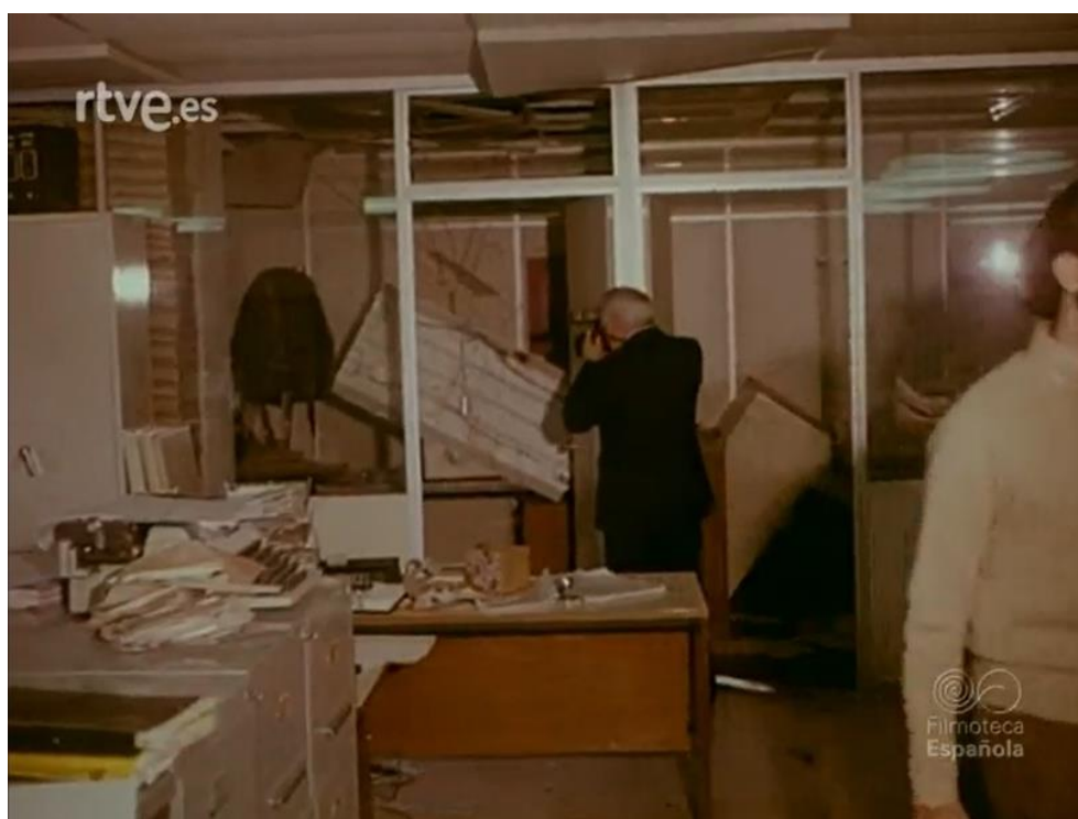
Figura nº 8: Lugar del atentado en el diario El País .

el semanario de humor satírico El Pápus en septiembre de 1977. La gran diferencia de este tercer programa respecto a los dos anteriores ejemplos de Informe Semanal está en la posibilidad de los periodistas de TVE de poder opinar sin ser censurados o despedidos. Una libertad de expresión que será ratificada tras la aprobación de la Constitución Española, que en su artículo veinte establece el derecho “a comunicar o recibir libremente información veraz por cualquier medio de difusión” 39 .