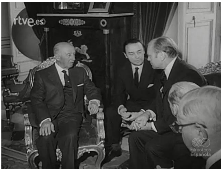
Figura nº 5: Franco recibiendo el pésame de Gerald Ford.

Sin embargo, si algo llama la atención de los cuatro primeros minutos del noticiario especial es la ausencia de Franco, que desde hacía meses sufría problemas de salud y evitaba mostrarse en público para no hacer patente su fragilidad. Por esta razón, tan sólo aparece brevemente un poco más adelante, concretamente menos de un minuto y treinta segundos, recibiendo en una sala de visitas el pésame del vicepresidente de Estados Unidos y luego, ya en su despacho, el correspondiente del jefe de gobierno portugués: