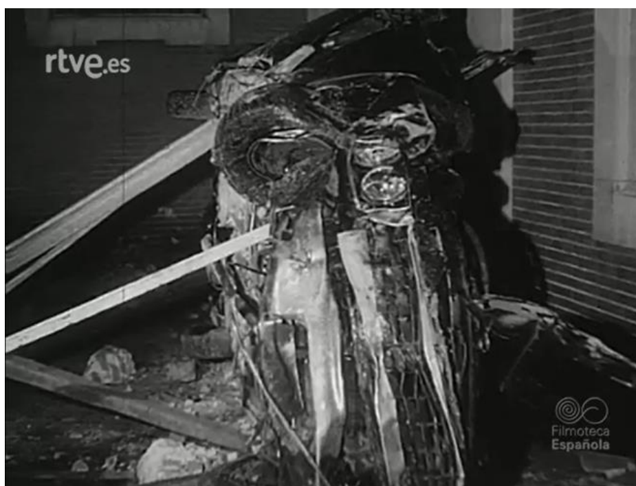
Figura nº 4: Automóvil oficial de Carrero Blanco, Dodge 3700 GT, completamente destrozado e irreconocible.

Además, los realizadores del NO-DO mostraron detalles de la investigación en curso, tales como una raya en un muro cercano -que sirvió de señal de referencia para accionar el artefacto explosivo-, o el túnel construido por los etarras para llegar al centro de la calzada. Tampoco hay reparos en enseñar la trayectoria seguida por el vuelo del vehículo, así como los restos de este, tal y como se puede observar en la imagen (Figura nº 4). Merece la pena recuperar las palabras del locutor de esta parte: