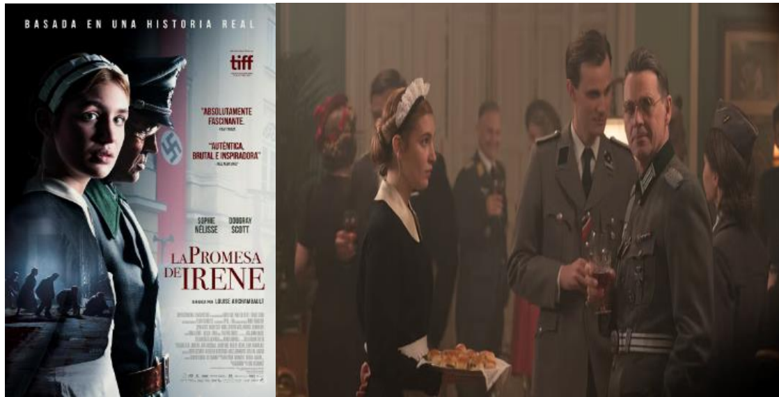
Figura 13: Cartel y fotograma de la película La promesa de Irene .

Canadá, Polonia. 2023. Idiomas: Inglés. Color. 121 min.