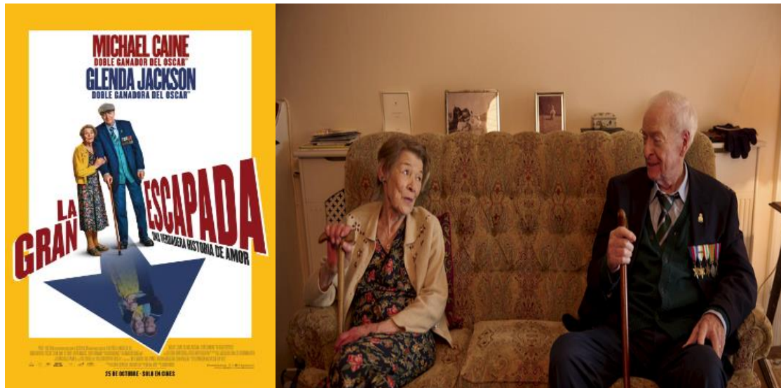
Figura 12: Cartel y fotograma de la película La gran escapada .

La edición de este año del festival ha tenido el honor de proyectar la que será, última película de uno de los mayores intérpretes del cine británico: Sir Michael Caine. Un rostro que nos ha acompañado a lo largo de más de sesenta años. Una cara familiar, casi un amigo. Y, por lo que trasciende de la lectura de sus amenos y divertidos libros de memorias, un gran tipo, pero especialmente, un grandísimo actor.