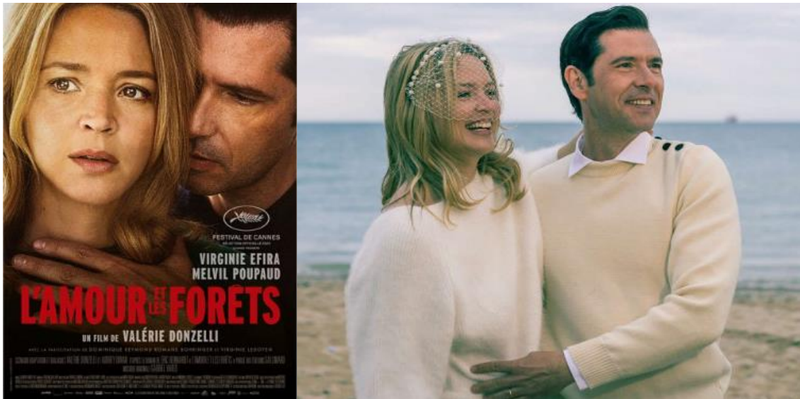
Figura 11: Cartel y fotograma de la película Solo para mí .

Francia. 2023. Idiomas: Francés. Color. 105 min.