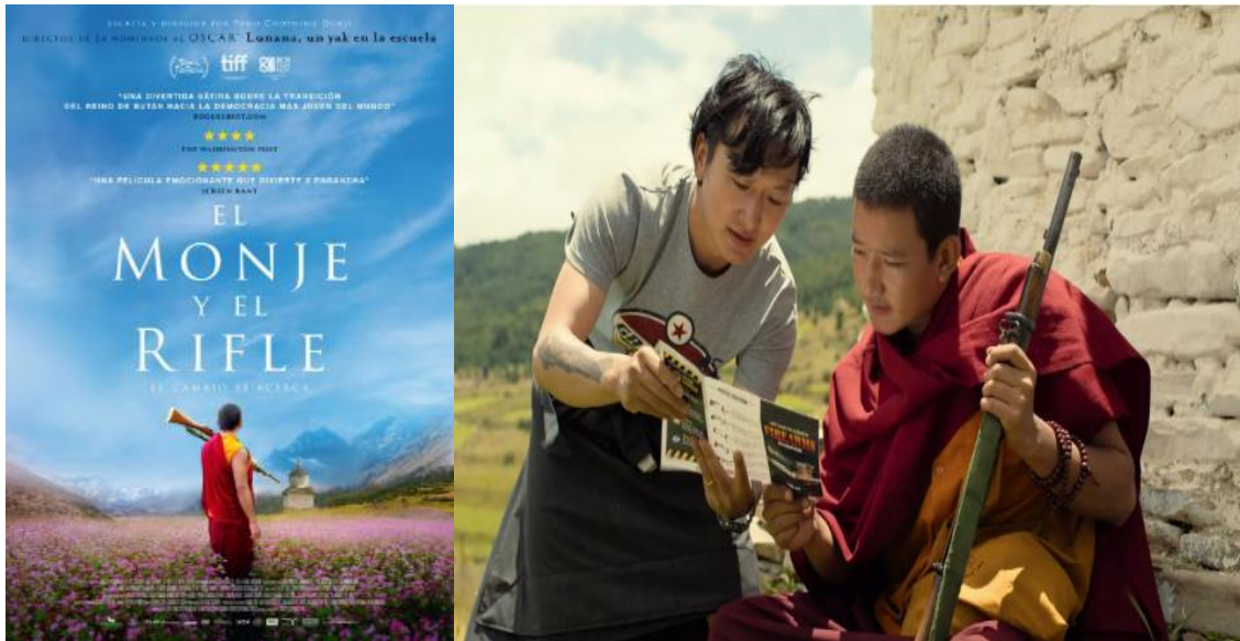
Figura 8: Cartel y fotograma de la película El monje y el rifle .

La vuelta de Pawo Choyning Dorji a las pantallas del festival no defraudó. El autor de la aclamada y simpática Lunana: un yak en la escuela ( Lunana: A yak in the classroom , 2019), vuelve a la carga con una historia ambientada en los celestiales paisajes del Bhután y sus curiosos habitantes, tan cercanos a nosotros y, a la vez, tan lejanos. El monje y el rifle ( The monk and the gun ) es una acerada y vitriólica crítica al consumismo y materialismo del mundo occidental y de cómo éste va ganando terreno a una vida -la del Bhután- orientada a la religiosidad, al misticismo y al bien común superpuesto a las necesidades egoístas y banales del individuo. Película de ritmo pausado, que no lento, y presidida por un sano y jocosos sentido del humor es, al igual que Lunana , un acertado y sensible canto a una forma de vida que parece en extinción.