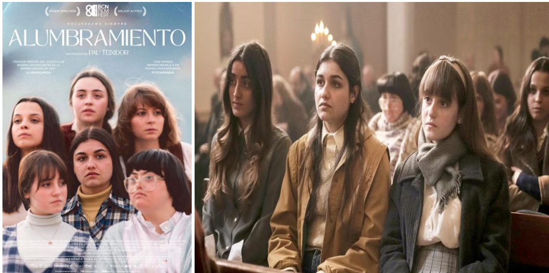
Figura 3: Cartel y fotograma de la película Alumbramiento .

España, Rumanía. 2024. Idiomas: Español. Color. 101 min