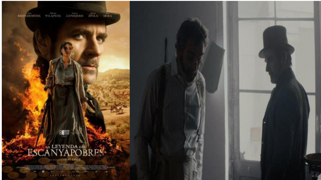
Figura 9: Cartel y fotograma de la película La leyenda del Escanyapobres .

La leyenda del Escanyapobres ( Escanyapobres ) es la adaptación cinematográfica de la novela homónima de Narcís Oller, el gran clásico de la literatura naturalista catalana del siglo XIX. Partiendo de una base tan sólida como la reputada novela de Oller, Ibai Abad realiza una adaptación fiel y pulcra, dotando a la cinta de buen ritmo y de unas gotas de originalidad como ese aire a western en el ambiente del pueblo o en la taberna que conceden de interés a la película. Con un reparto presidido por el personaje desagradable y rudo Àlex Brendemühl y una Laura Conejero que borda su role de femme fatale ; La leyenda del Escanyapobres es una buena muestra del excelente estado de salud del cine catalán en este 2024.