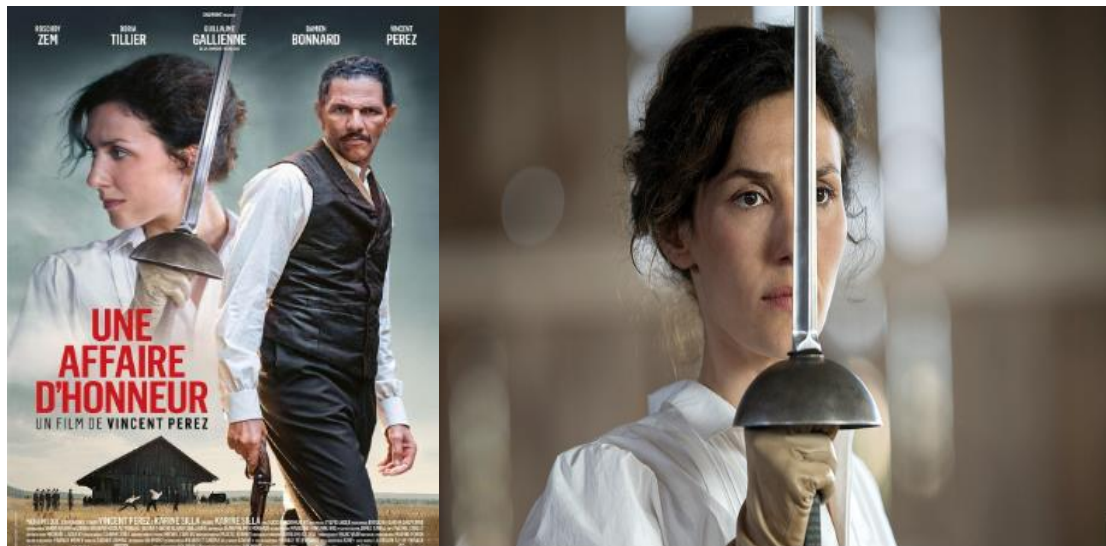
Figura 4: Cartel y fotograma de la película El profesor de esgrima ..

Francia. 2023. Idiomas: Francés. Color. 101 min.