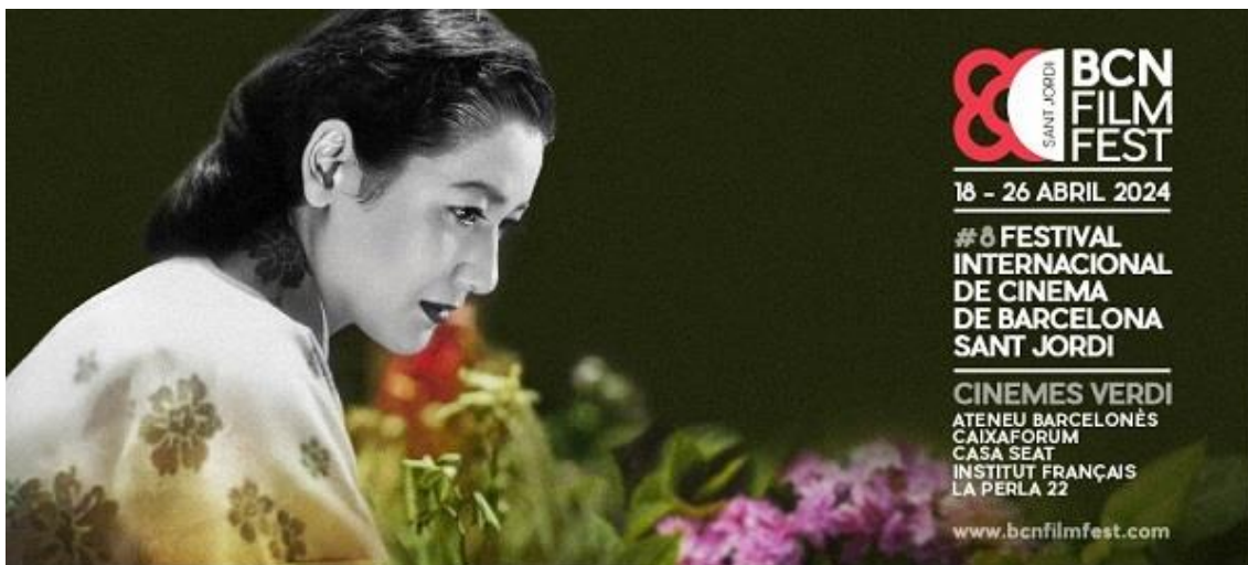
Figura 1: Cartel del BCN Film Fest

ORCID: https://orcid.org/0009-0008-3602-7201