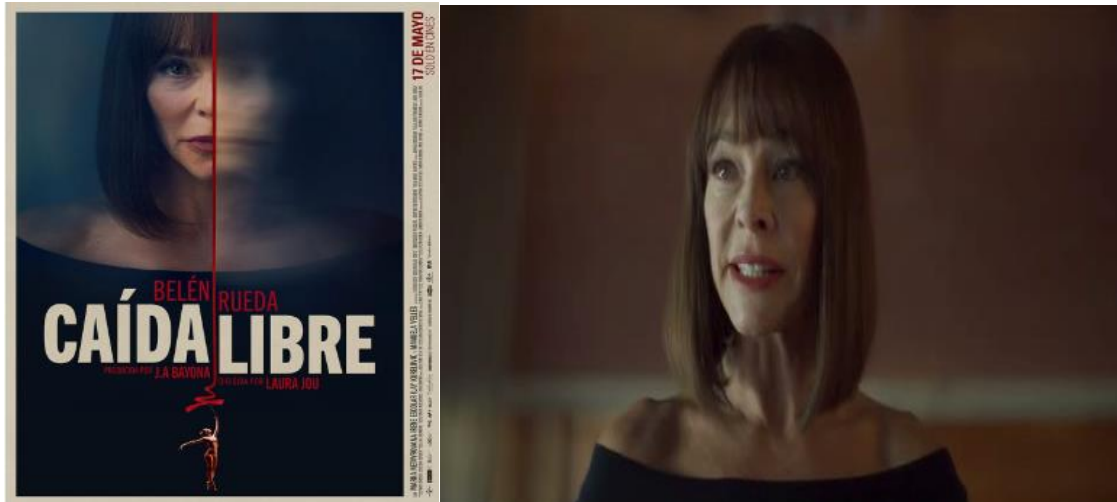
Figura 5: Cartel y fotograma de la película Caída libre ..

España. 2024. Idiomas: Español. Color. 89 min.