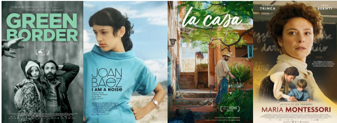
Figura 15. Carteles de películas presentadas.