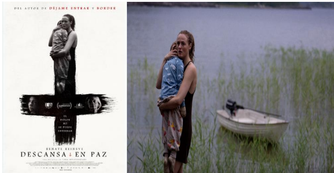
Figura 6: Cartel y fotograma de la película Descansa en paz .

Descansa en paz ( Håndtering av udøde ) era una de las cintas más esperadas del festival. Y no es de extrañar. En primer lugar, por el relevante papel que está jugando la cinematografía escandinava en el género de terror en las últimas décadas y, en segundo lugar, por ser el debut en el mundo del largo de una cortometrajista conocida en el mundo del fantastique , Thea Hvistendahl. Bajo una premisa un tanto manida, pero con gotas de originalidad -los muertos resucitan y vuelven a vivir con sus seres queridos- esta zombie movie tiene un arranque magnífico (la secuencia del abuelo y su difunto nieto en el cementerio) pero se va diluyendo como un azucarillo, presa de su ritmo moroso y de situaciones hartas vistas en otras cintas del género. Uno se queda con la sensación de que hubiera sido un buen corto o un buen mediodiámetro pero no un largo. Había buenas ideas, buena atmósfera pero poco más.