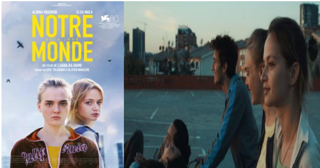
Figura 14: Cartel y fotograma de la película Phantom Youth .

Francia, Kosovo. 2023. Idiomas: Albanés. Color. 94 min.