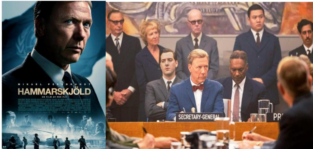
Figura 10: Cartel y fotograma de la película Lucha por la paz .

Los grandes personajes históricos han sido siempre protagonistas en el Bcn Film FEst. En Hammar skjöld. Lucha por la paz (Hammar skjöld) nos centramos en la figura de Dag Hammarskjöld, el que fuera segundo Secretario General de la ONU, fallecido en extrañas circunstancias, y que todavía hoy en día sesenta años después no han sido aclaradas y siguen siendo pasto de diversas teorías conspirativas, más o menos acertadas. La importancia de Dag Hammarskjöld es incuestionable. Puso las bases de la moderna administración de la ONU, fundó los Cascos Azules, ordenando sus primeras misiones, y tuvo la valentía y osadía de enfrentarse a las dos superpotencias en plena Guerra Fría, al ser un firme defensor de los procesos de descolonización de Asia y África; algo que posiblemente le costó la vida. Siendo un biopic , género siempre pantanoso, Per Fly tiene el acierto de no realizar una hagiografía de Hammarskjöld, sino que nos muestra a un personaje dubitativo, presa de sus miedos, temeroso de fallar.