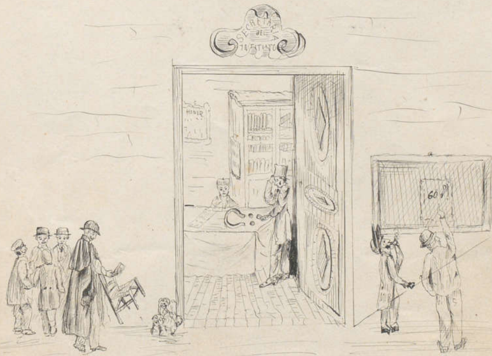
Entran que abran el oro y la plata.