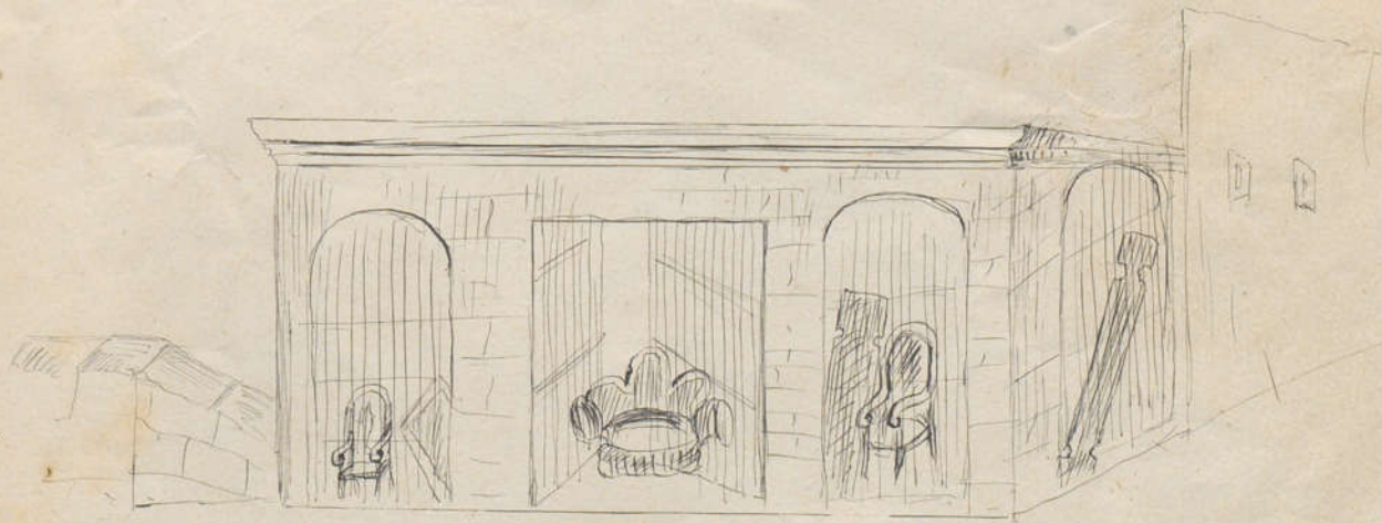
Meta morfosis del cuartelillo de Muralla de Mar