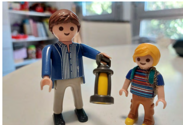
Figura 2. Tutor/a de resiliencia.

El profesorado puede realizar mejor su tarea cuando entiende que muchos de los problemas académicos, sociales y de comportamiento de los niños traumatizados implican dificultades como no entender las instrucciones o reaccionar exageradamente a los comentarios de profesores/as y compañeros/as, en lugar de pensar que no desean aprender o que son maleducados. En muchas ocasiones pueden llegar a convertirse en tutores/a de resiliencia , es decir, adultos importantes en su vida, que les ofrecen tanto afecto como estrategias y herramientas para aprender, y les ayudan a entender las dificultades que sufren, a valorarse como personas que merecen ser queridas, a reconocer sus propios recursos y habilidades, y a no sentirse culpables ni avergonzados por el daño recibido como consecuencia de la incompetencia de los adultos que no pudieron o no supieron cuidarles bien.