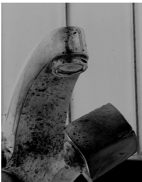
Julia Otxoa: "Meditazione dell'angelo dell'acqua" (2008)

Este eje salta también a la vista en la poesía visual: