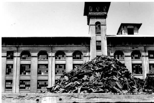
Julia Otxoa: "Informe Arendt" (2006)

La quinta enuncia la necesidad de la esperanza y la sexta, "Las capitulaciones", reflexiona sobre cómo la edad y el tiempo traicionan los ideales. La séptima aborda el problema de la mujer objeto, explotada, encarnada en Marilyn Monroe. La octava, dedicada a Odracir (emblema al revés de Ricardo, su marido), termina con la afirmación contundente de la vida.