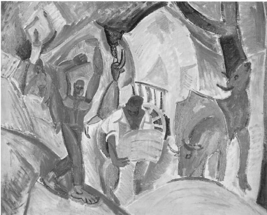
1. Pablo Picasso, Los segadores , 1907, óleo sobre tela, (65 × 81,5 cm), Museo Thyssen-Bornemisza, Madrid

1 Conferencia pronunciada el día 18 de octubre de 2006 en el «Ciclo de Conferencias sobre Picasso», en homenaje a Picasso en el centenario de su estancia en Barcelona. Este ciclo es el resultado del convenio firmado entre el Museu Picasso de Barcelona y la Universitat de Barcelona.