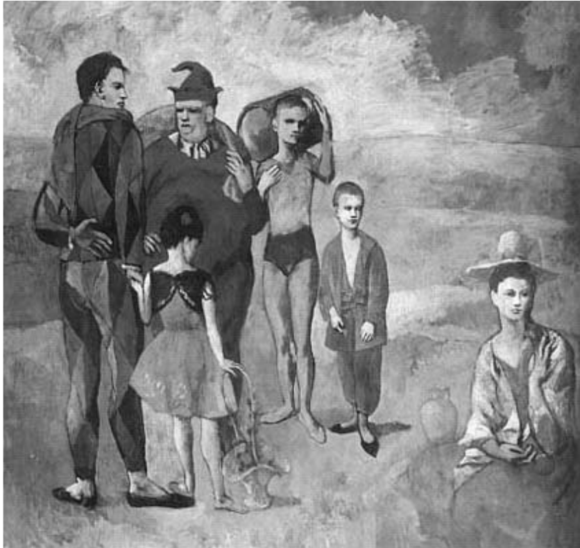
3. Pablo Picasso, Familia de saltimbanquis , 1905, óleo sobre tela, (215 × 229 cm), National Gallery of Art, Washington

ligera. Los temas se abren a las escenas en las que personajes del mundo del circo —arlequines y saltimbanquis—, pintados en ricas y cambiantes gamas de rosa hacen que sus telas aparezcan ante los ojos del espectador con un carácter más amable (fig. 3). Surge incluso algún dibujo como aquél en el que el propio artista observa cómo duerme su novia Fernande Olivier, en el cual el color es casi exaltado. El amarillo le otorga un punto de calidez que en aquella época resulta un tanto extraño.