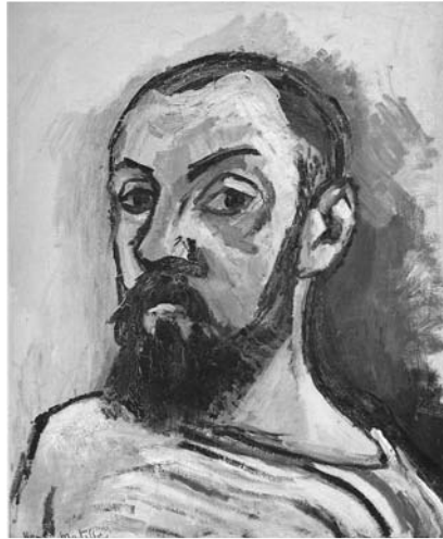
6. Henri Matisse, Autorretrato , 1906, óleo sobre tela, (55 x 46 cm), Staatens Museum for Kunst, Copenhagen

Galería Berthe Weill. Entre los visitantes asiduos de la misma se hallaba Apollinaire con quien Picasso llegaría a tener una profunda amistad. Apollinaire, crítico y poeta, se interesó mucho por el movimiento fauve y seguramente debió conversar en no pocas ocasiones con Picasso en torno al mismo. Así, por tanto, Picasso no sólo asistió al nacimiento del Fauvismo, sino que tuvo siempre a su lado a una persona como Guillaume Apollinaire de gran capacidad crítica que pudo hablarle en profundidad de lo que el movimiento fauve suponía. ¿Fueron quizás los comentarios del propio Apollinaire los que mantuvieron a distancia a Picasso del Fauvismo?