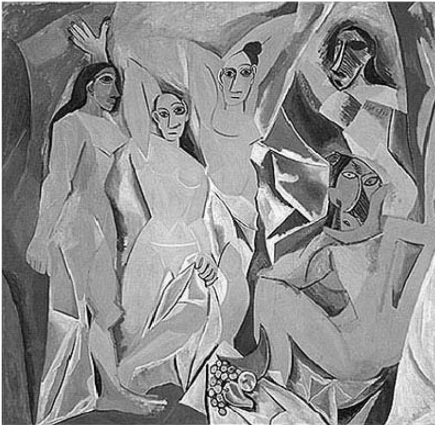
11. Pablo Picasso, Las señoritas de Avignon , 1907, óleo sobre tela, (243,9 × 233,7 cm), The Museum of Modern Art, Nueva York

En los dos meses y medio que Picasso pasó en Gósol pintó numerosas obras, tanto pequeños dibujos y esbozos como telas importantes al óleo. Uno de los aspectos que quizás contribuye a establecer la presencia de un hilo conductor entre las distintas realizaciones es el cromático. En Gósol las composiciones picassianas dejan de pertenecer al llamado período rosa —aunque es evidente que el artista seguirá empleando diversas tonalidades de rosas— para incorporar un nuevo color, el ocre que otorga a sus cuadros de ese momento una especial tonalidad dorada. Por otro lado, en Gósol, Picasso muestra claramente su inclinación por el denominado mediterraneísmo, aunque existen otras pinturas en ese mismo contexto muy lejanas de dicha concepción. Se trata de obras de crudo realismo como, por ejemplo, aquellas en las que retrata a personajes del pueblo o bien se decanta por plasmar escenas campestres. Existe además un grupo de pinturas como El Harén (fig. 10) o Tres Desnudos en las que Picasso aporta nuevas y trascendentes ideas que culminarán algo después en la famosa pintura Las señoritas de Avignon .