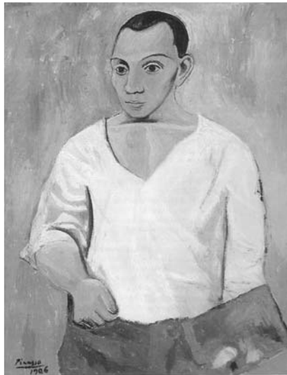
5. Pablo Picasso, Autorretrato de la paleta , 1906, óleo sobre tela, (91,9 × 73,3 cm), The Philadelphia Museum of Art, Filadelfia

tes tanto en el ámbito cultural parisino como en los círculos de personas de alto nivel económico.