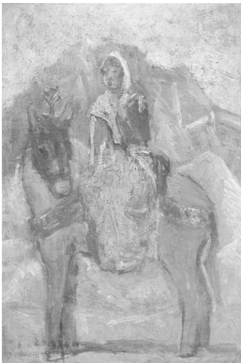
9. Pablo Picasso, Fernande sobre un mulo , Gósol 1906, óleo sobre madera, (30 × 20,5 cm), Colección Marina Picasso