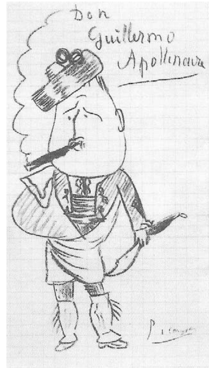
4. Pablo Picasso, Caricatura: Don Guillermo Apollinaire , 1905, lápiz sobre papel, (11 × 6,4 cm), The Metropolitan Museum, Nueva York

También conoció a los hermanos Gertrude y Leo Stein —importantes coleccionistas de arte— que, sin duda alguna, contribuyeron en gran medida a cambiar la opinión que se tenía en París sobre Picasso en 1905. De ser un artista apenas conocido su nombre pasó a estar en boca de los amigos de los Stein que eran muchos y que además eran personas influyen-