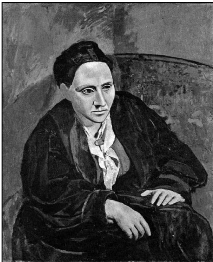
7. Pablo Picasso, Retrato de Gertrude Stein , 1905-06, óleo sobre tela, (100 × 81,3 cm), The Metropolitan Museum of Art, Nueva York

En otoño de 1905 Picasso comenzó el retrato de Gertrude Stein y lo concluyó en julio del año siguiente (fig. 7). Fueron noventa sesiones de trabajo en las que Stein posó para el artista. Picasso se negó a dejarle ver el cuadro hasta que estuviera acabado. Durante todo ese tiempo se estableció entre ambos una buena amistad y, además, la obra pictórica que surgió de esos encuentros tuvo, sin duda alguna, gran trascendencia en el quehacer picassiano posterior. Cuando, por fin, Gertrude Stein pudo ver su retrato, no daba crédito a sus ojos y dijo a Picasso que ella no se parecía a la que allí había representada. Picasso le contestó: «No te preocupes, ya te parecerás».