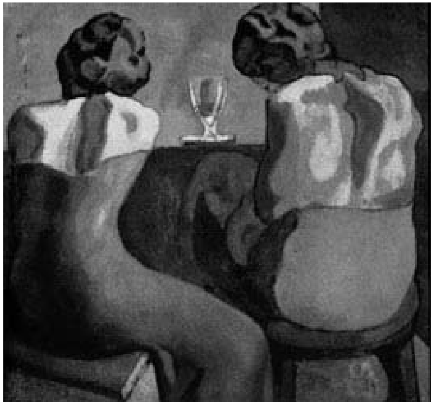
2. Pablo Picasso, Dos mujeres en el bar , 1902, óleo sobre tela, (80 × 91,5 cm), Colección Chrysler, Nueva York

Picasso había realizado entre 1902 y 1905 —es decir, la época que John Elderfield denomina prefauve — un titánico esfuerzo por alejarse de la pintura tradicional, aquella que él dominaba ya sin esfuerzo alguno antes de concluir el siglo XIX, cuando apenas contaba quince años de edad. Esa idea fue la que le condujo a inventar las conocidas etapas azul y rosa. En la primera de ellas, el artista trabaja, como se sabe, planteando una temática en la que la soledad, la angustia e incluso la miseria, tanto material como espiritual, se halla presente en personajes y ambientes, gracias sobre todo a la simplificación de los temas como a la restricción drástica de la gama cromática a las tonalidades de azul (fig. 2). Ya en la etapa rosa la tensión se hace más