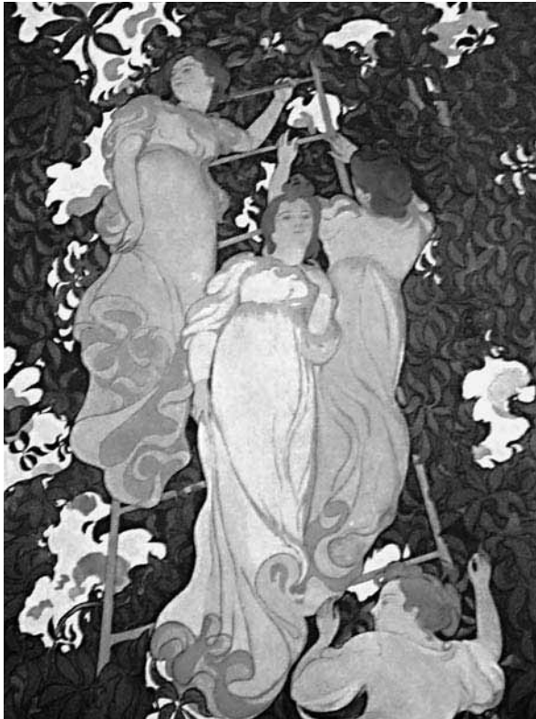
L'échelle dans le feuillage / Arabesques poétiques pour la décoration d'un plafond , 1892. Oli sobre tela enganxada a cartró, 235 x 172 cms.

Aurier ja n'havia definit els preceptes, els quals queden perfectament plasmats en la pintura de Denis: ideisme, simbolisme, sintetisme, subjectivisme, i decorativisme 5 .