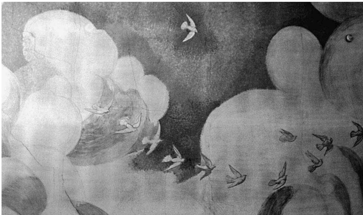
Frescs al sostre de la Capella del Prieuré.