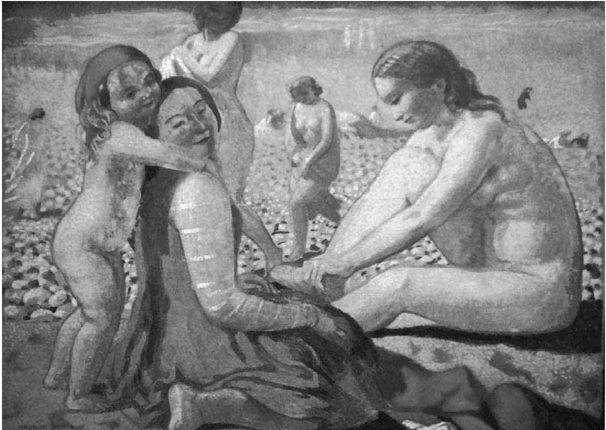
Plage au bonnet rouge , 1909. Oli sobre llenç, 95 x 125 cms.

ció, que es trobessin d'acord amb els criteris emprats per la tradició. És a dir que, per mitjà del mètode clàssic, les obres actuals assimilarien els continguts procedents de la tradició i s'hi fondrien. S'entroncava així amb l'esplendor artístic de l'antiguitat i dels Mestres del passat que saberen entendre-la, com ara Ingres, Poussin, Cézanne i el mateix Pierre Puvis de Chavannes.