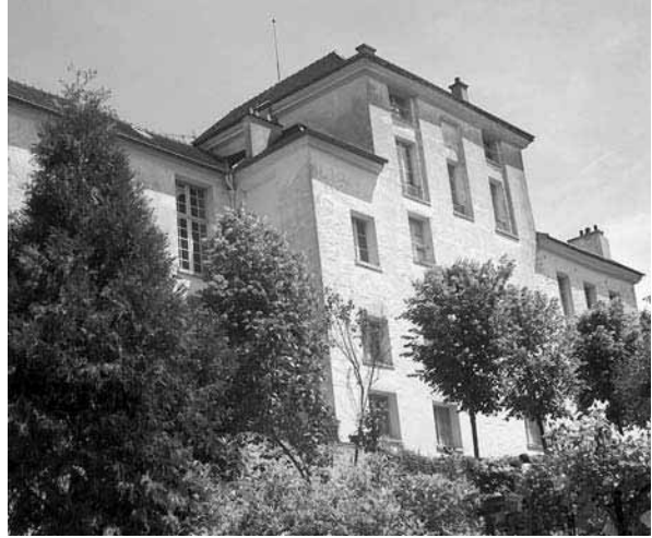
Façana sud del Musée Départementale Maurice Denis, a Saint-Germain-en-Laye, Yvelines.

D'altra banda, en els darrers anys s'ha anat revaloritzant l'aportació de Denis a la construcció del nou classicisme francès de principis del segle proppassat,