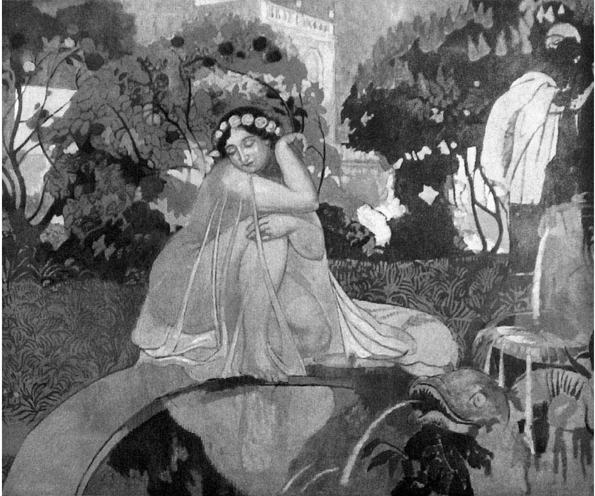
Nu au bassin , v.1918. Oli sobre llenç, 190 x 231 cms.

Certament, considerava que el canvi d'estil endegat per Denis era el fruit d'una personalitat trànsfuga, fruit del seu «temperament fenici», que abandonava «l'esquerra de la pintura» —el simbolisme—, per avançar en la direcció oposada: el conservadorisme nacionalista.