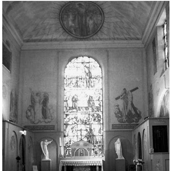
Vista general de l'absis de la Capella del Prieuré, annexa al Musée Maurice Denis, reformada pels Ateliers d'Art Sacré entre 1915 i 1928.

Les intervencions efectuades pels Ateliers d'Art Sacré contribuïren, en gran mesura, a la recepció que en féu la premsa de mitjans de segle xx, encara que les obres sobre cavallet d'inspiració religiosa que emprengué l'artista a títol personal també foren tingudes en compte. Alhora, la publicació de l'obra Histoire de l'art religieux , apareguda el 1939 55 , contribuï a forjar la concepció de Denis com a artista principalment religiós.