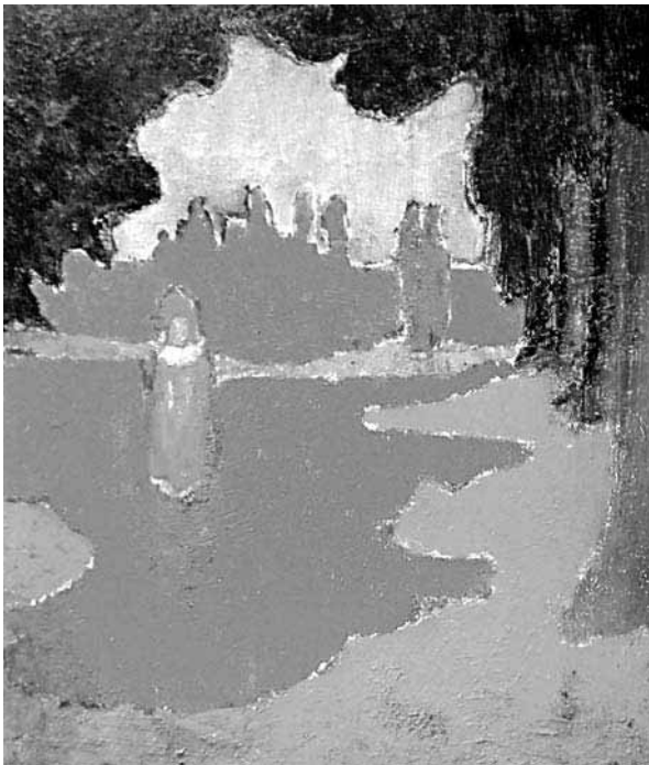
Tache de soleil sur la terrasse , 1890. Oli sobre cartró, 24 x 20,5 cms. Musée d'Orsay.

Gállego posava de manifest, així doncs, les aportacions de Denis en la pintura religiosa, en clau de modernitat. La mateixa línia reivindicativa encetada per Gállego, és continuada per F. Destremau, que en un article aparegut el 1987, versava sobre les innovacions introduïdes per l'artista a l'art cristià i, en general, a la plàstica del primer terç de segle xx 65 . Destremau destacava, per tal d'emfasitzar la modernitat dels plantejaments de Denis, la introducció en la seva producció de l'expressió de la quarta dimensió: la de la durada viscuda per l'artista 66 , que seria després adoptada pel cubisme.