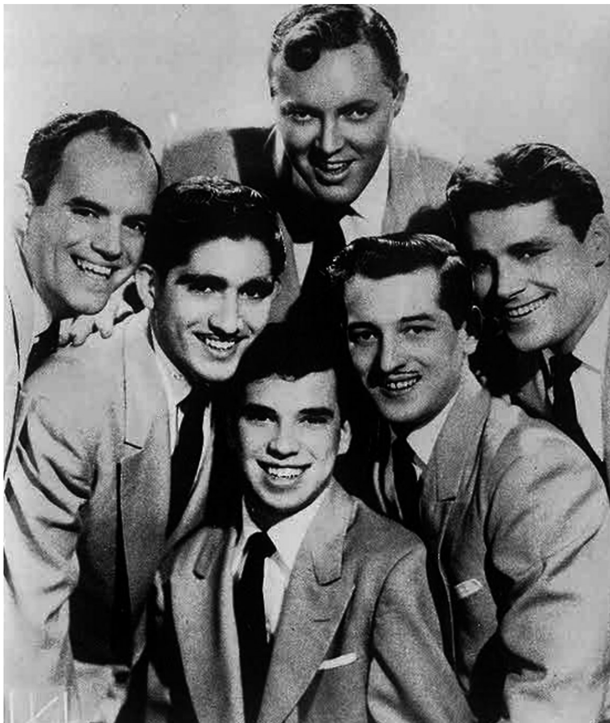
Bill Haley and The Comets