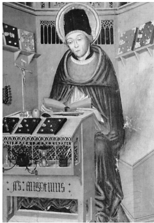
Sant Agustí, Vic, Museu Episcopal

fons de la gran sala sinó que enllaça amb la que entra per les obertures quadrades de la planta baixa, visibles a un costat i altre del cadafal. Per damunt d'aquest, tres parelles de finestres geminades reflecteixen claror a les altes voltes d'aresta i retallen llargs estendards de cel blau. Si no fos per la solidesa dels volums que l'ancoren a terra, l'estructura de fusta apareixeria com una gran barca surant enmig d'un univers lluminós. Aquest és l'espai confortable on tot estudiós desitja recloure's, allunyat del brogit i envoltat de llibres, papers, plomes, pots, capsetes, post-it, pòsters, bonsais i animals de companyia preferits. Ací és on els estímuls rebuts prenen cos, s'ordenen les idees i maduren les teories, després de confrontar-les amb les exposades en el material recopilat.