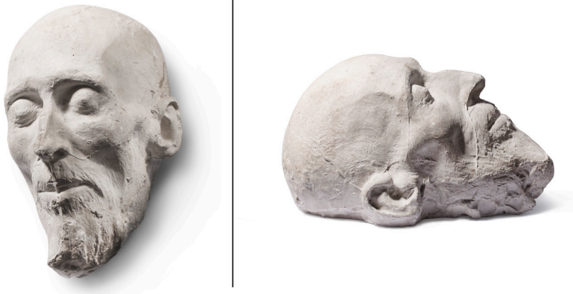
Fig. 9. Enric Clarasó, Màscara mortuòria de Francesc Soler i Rovirosa , 1900, guix, MFM 3916. Museu Frederic Marès.