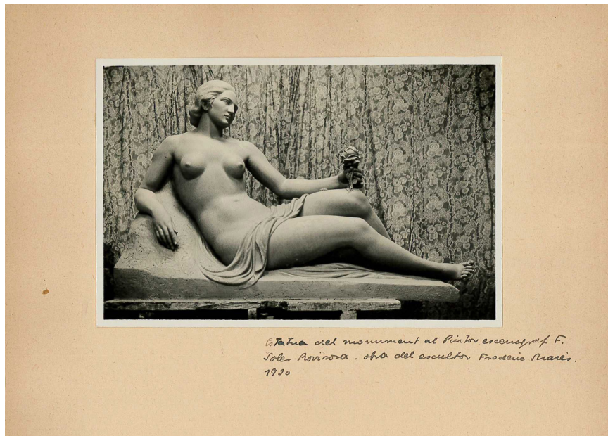
Fig. 3. Model per al Monument a Francesc Soler i Rovirosa , 1929, fotografia, Centre de Documentació i Recerca, Museu Frederic Marès.

Pel que fa a la mida, el model que estem analitzant és menor que l'obra definitiva. El Museu Frederic Marès conserva una fotografia d'un model posterior (fig. 3), que es tracta, molt probablement, del guix que actualment forma part de la seva col·lecció 34 , presa al davant de la mateixa cortina florejada i els motius de la qual es veuen força més petits. Al Museu es conser-