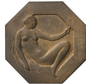
Fig. 5. Frederic Marès, Prova d'encunyació d'una medalla , 1927, llautó daurat, MFM 3195. Museu Frederic Marès.

Pel que fa a la representació del rostre de l'homenatjat, comprovem que al primer model del monument (fig. 2) apareixia de front dins del medalló ubicat al centre de la base. Aquesta posició era segurament amb la que l'identificava la majoria de població que l'associava amb la fotografia que Pau Audouard i Deglaire (1856-1919) 38 va fer a Soler i Rovirosa (fig. 6) i que el pintor i dibuixant Ramon Casas i Carbó (1866-1932) va utilitzar per a retratar-lo pòstumament (fig. 7). Al monument definitiu però, l'escultor va decidir presentar l'escenògraf de perfil 39 . Creiem que aquest canvi el propiciaria l'estudi de primera mà de la màscara mortuòria de Soler i Rovirosa que facilitaria a Marès la seguretat de representar-lo de manera fidel al seu físic i a la tradició medallística. És possible que aquesta confiança es veiés reforçada també pel coneixement que l'escultor tindria del bust de Soler i Rovirosa, propietat de la Junta de Museus, que es va col·locar a la sala de descans del Liceu mentre durà l'exposició de la seva obra l'any 1927 40 i 41 .