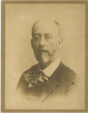
Fig. 6. Audouard, Retrat de Francesc Soler i Rovirosa , c. 1880, fotografia, Topogràfic F 83-08, Registre 262576, Centre de Documentació i Museu de les Arts Escèniques (MAE).