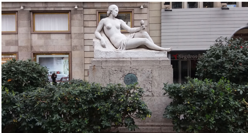
Fig. 1. Frederic Marès, Monument a Francesc Soler i Rovirosa, 1930.

«i Al capdavant s'ha hagut de rendir!... Després de set mesos ¡set mesos! De esgurri-fosa lluyta, la mort ha pogut mes qu'aquell home de seixanta cinch anys, a qui tothom n'hi feya menos, perquè se'l veyia sempre actiu, sempre aixerit, sempre garlayre y sempre al peu del canó, ab la rialla à flor d'ulls y l'anècdota i la boca. [...] ¡Quina desgracia pera tota els que eram els seus amichs! Ab la mort del gran escenògraf, indubtablement el més gran que hi ha hagut à Espanya, també perdém al gras connaisseur d'art y al gran narrador dels fets artístichs y socials que havia finament observat durant la seva vida. Els que, portats pels nostres estu-