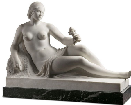
Fig. 4. Frederic Marès, Dona ajaguda amb una flor a la mà del monument a Francesc Soler i Rovirosa , 1930, marbre, 52 x 78 x 25 cm, MFM 3089. Museu Frederic Marès.

Com a precedent de la figura principal del monument citarem també la prova d'encunyació d'una medalla en la qual hi apareix una dona nua ajaguda sostenint una branca de llorer a la mà (fig. 5) que, com veiem als seus estudis preparatoris 36 , era una prova per a la medalla del Foment de les Arts Decoratives (1927) 37 que finalment no va incorporar aquesta figura.