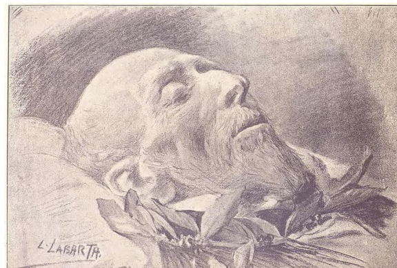
Fig. 12. Lluís Labarta, Francesc Soler i Rovirosa al llit de mort , 1900, dibuix publicat a la revista Pèl & Ploma el 15 de desembre de 1900.

potser també d'un bust del propi Soler i Rovirosa 48 . D'altra banda, cabria la possibilitat de pensar que la voluntat de Clarasó en l'execució de la màscara de Soler i Rovirosa fos el seu ús en un futur monument.