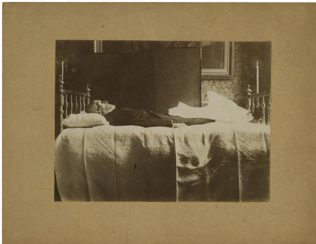
Fig. 10. Francesc Soler i Rovirosa al llit de mort , 1900, fotografia, Topogràfic: F 83-11, Registre: 262915, Centre de Documentació i Museu de les Arts Escèniques (MAE).

ció. Aquest dibuix es va publicar a la revista Pèl & Ploma el 15 de desembre de 1900, juntament amb un article d'homenatge al difunt escrit pel mateix Labarta, deixeble del gran mestre escenògraf 47 .