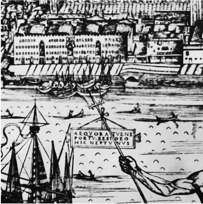
FIGURE 5. Grenier de Terra Nova, détail de la vue perspective de Venise de Jacopo de' Barbari, 1500.

ments urbains sont de bons observatoires pour comparer les univers urbains méditerranéens, car ils sont à la fois indicateurs de la production disponible à faible distance, des formes de financement de l'agriculture (selon des modalités d'achats anticipés pour remplir les greniers publics), de l'organisation du marché céréalier et de ses contraintes, des politiques publiques (part de la consommation placée sous tutelle publique), des régimes alimentaires et de leurs transformations. En d'autres termes, dans le monde urbain, les entrepôts céréaliers sont des lieux-clés, pour l'économie agraire, la stabilité politique et la garantie de l'ordre public, la subsistance et la santé des populations urbaines.