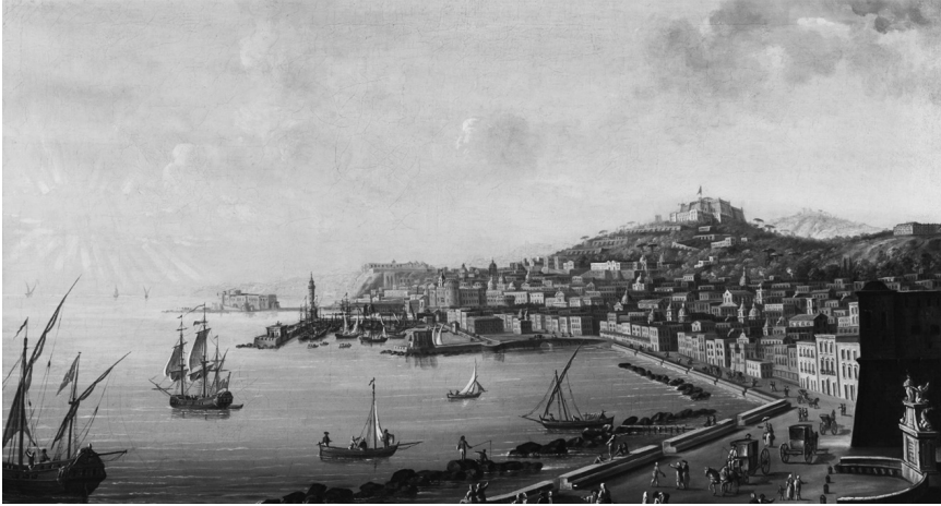
FIGURE 4. Antonio Joli, vue du littoral oriental de Naples, vers 1750. Reggia di Caserta.

la seconde moitié du XVIII e siècle. Les vues de Naples d'Antonio Joli renvoient à une autre configuration articulant espaces urbains et zones littorales. Elles mettent en images les grands travaux d'aménagement portuaire et littoral réalisés par les Bourbons à partir des années 1740, la séparation entre le port militaire et le port de commerce. Aux usages commerciaux se surimposent de nouvelles fonctions récréatives, avec la réalisation d'embellissements sous la forme de promenades aristocratiques: celle de la Via Marina, dans les années 1740, de la Riviera di Chiaia, dans les années 1780, tendent à éloigner de ces littoraux urbains les gens de mer, pour situer leurs habitations dans des faubourgs côtiers plus éloignés. Les différences à la fois économiques et morphologiques entre ces deux situations urbaines et portuaires ne doivent pas cacher des points communs qu'il conviendrait de vérifier sur d'autres cas d'étude: la densité et l'intensité des conflits de compétences sur les espaces littoraux et portuaires où se superposent de nombreuses juridictions, et le cadre qu'elles offrent aux mobilisations sociales pour les ressources que constitue l'espace littoral. À Naples, gouvernement local et pouvoir local s'affrontent au sujet de la construction de la Via Marina, un