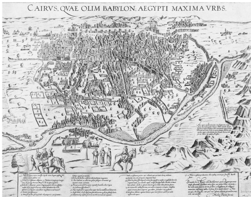
FIGURE 2. Cairus, quae olim Babylon, Aegypti maxima Urbs , Matteo Florimi (1550–1600).

La dimension urbaine du bassin occidental s'est en revanche fortement réduite après la chute de Rome. Au Moyen Âge, les centres urbains restent modestes, et ce n'est qu'avec les débuts de la période moderne que certaines villes, dans la Péninsule italienne, atteignent les 100 000 habitants. Se forme alors ce que Fernand Braudel a appelé le «quadrilatère développé», à savoir un une aire d'intense urbanisation en Vénétie, en Lombardie, en Toscane, où Venise, Milan, Florence, Gênes, se présentent comme de petites métropoles économiques. Au Sud de l'Italie, Naples fait figure d'exception, de «monstre démographique»: seconde ville d'Europe et de Méditerranée, par rang de taille, 19 elle at-