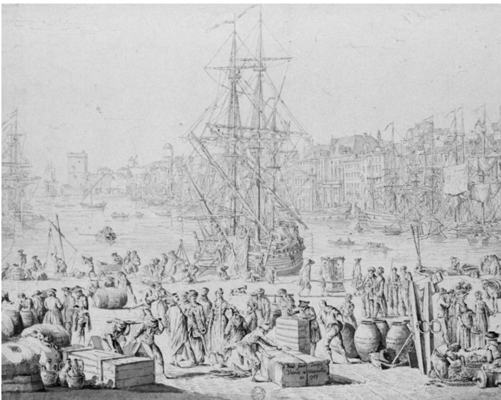
FIGURE 3. Le port de Marseille, dessin d'après Joseph Vernet, XVIII e siècle.

Dans un contexte de croissance urbaine et de développement des échanges maritimes, les peintres posent un nouveau regard sur les espaces portuaires au milieu du XVIII e siècle. Pensons à la série des ports de France, 24 tableaux commandés par le marquis de Marigny, surintendant des Bâtiments, Arts, Jardins et Manufactures de Louis XV, au peintre Joseph Vernet en 1753 (Fig. 3); ou à l'émergence, à Naples, d'un modèle de représentation permettant d'embrasser l'ensemble du littoral urbain, par un double point de vue, associant une vue orientale et une vue occidentale de la ville (Fig. 4). Ces représentations nouvelles reflètent l'articulation entre politiques mercantiles, réaménagement des structures portuaires et des fronts de mer urbains, et nouveaux usages sociaux de l'espace. L'intérieur du port de Marseille (vu depuis le Pavillon de l'Horloge) et L'entrée du port de Marseille de Joseph Vernet donnent à voir un port au cœur de la ville (vues intérieure et extérieure), sur lequel pèse fortement la présence de l'arsenal des galères voulu par Louis XIV à la fin du XVII e siècle, emplacement ensuite cédé à la Ville qui y réalise un lotissement dans