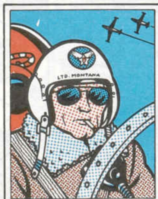
Sirviendo a la patria. Corea, 1952.

"SI BIEN LOS PURISTAS PUDIERAN HABLAR DE FALTA DE CONSISTENCIA EN LOS GUIONES Y DE EXCESIVA ATENCIÓN AL GÉNERO, PENSEMOS QUE POLACARA SE ENCUENTRA EN NUESTRA MEMORIA COLECTIVA AL LADO DE BUGG'S BUNNY, EL GUERRERO DEL ANTÍFAZ, ALADINO Y SPIDERMAN." ROMA CUBERT, Historia de los Cómics, Vol. I.