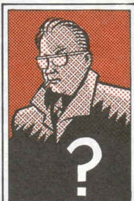
La última fotografía del autor.

"... ME CONSIDERO UN BUEN ARTESANO, PERO NUNCA ME HICE RICO (...) AHORA HAY MUCHA MIERDA, ESO ES LO QUE HAY" De la última entrevista de MONTANA.