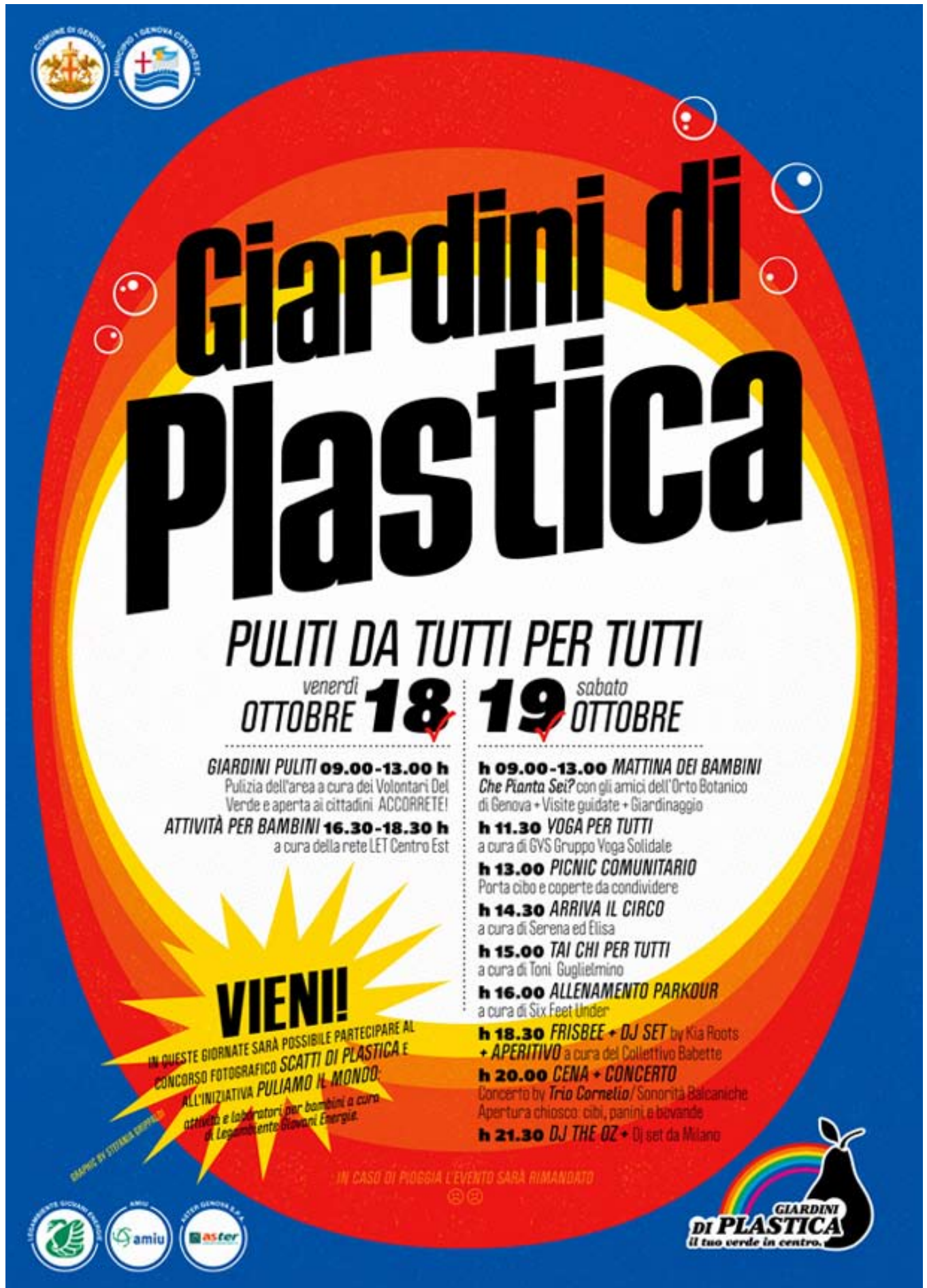
Fig. 13: Manifesto con cui l'Associazione Giardini di Plastica invita la cittadinanza a partecipare a due giornate di eventi organizzati ai Giardini Baltimora e a ripulire l'area dai rifiuti