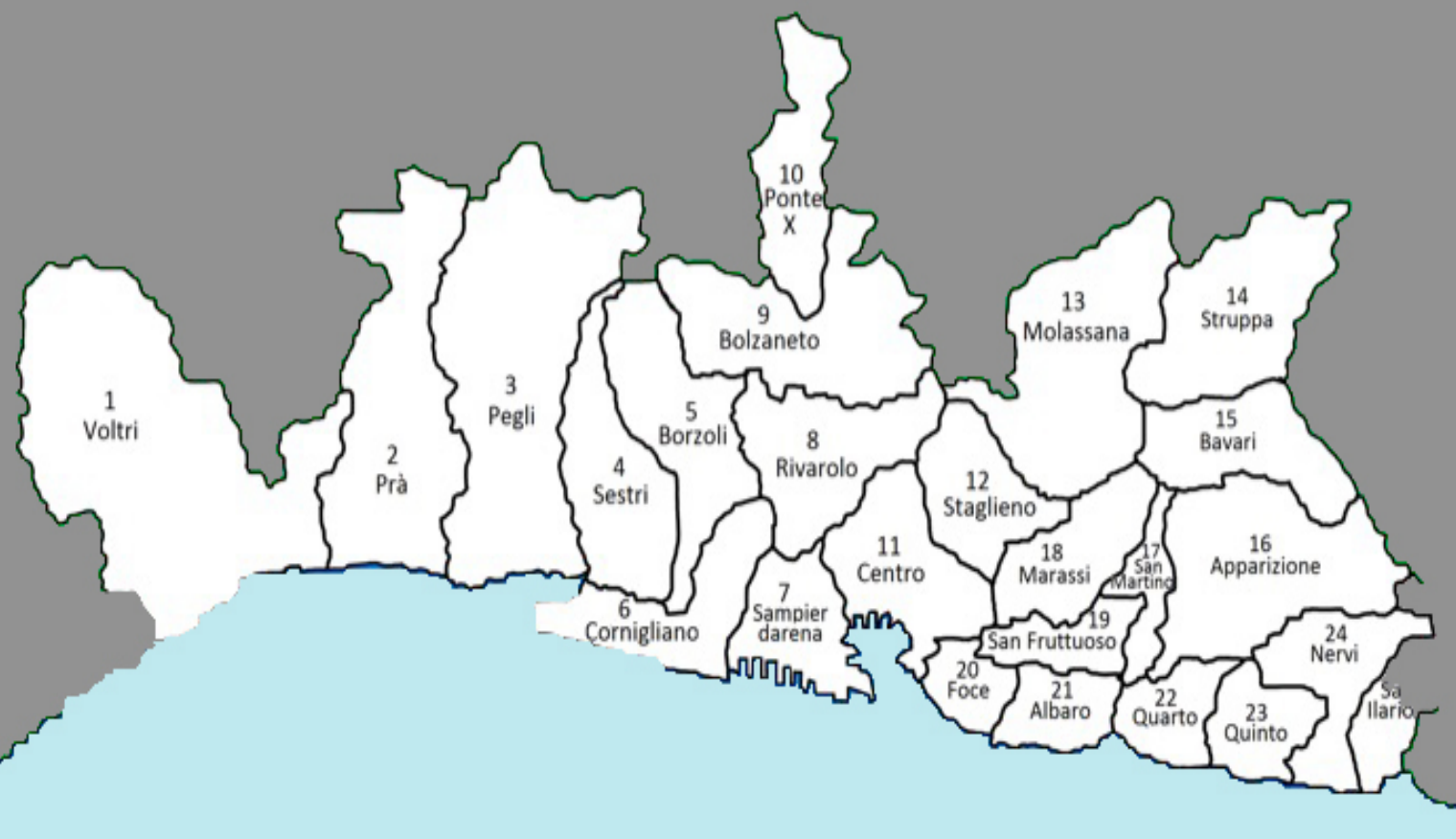
Fig. 1: Suddivisione schematica dell’area urbana di Genova nei suoi quartieri

In effetti, tanto per l’orografia del suo territorio quanto per le peculiari vicende della sua storia novecentesca, il capoluogo ligure presenta oggi caratteristiche che rendono estremamente difficile ragionare in termini di centro, di zone di espansione e di periferie.