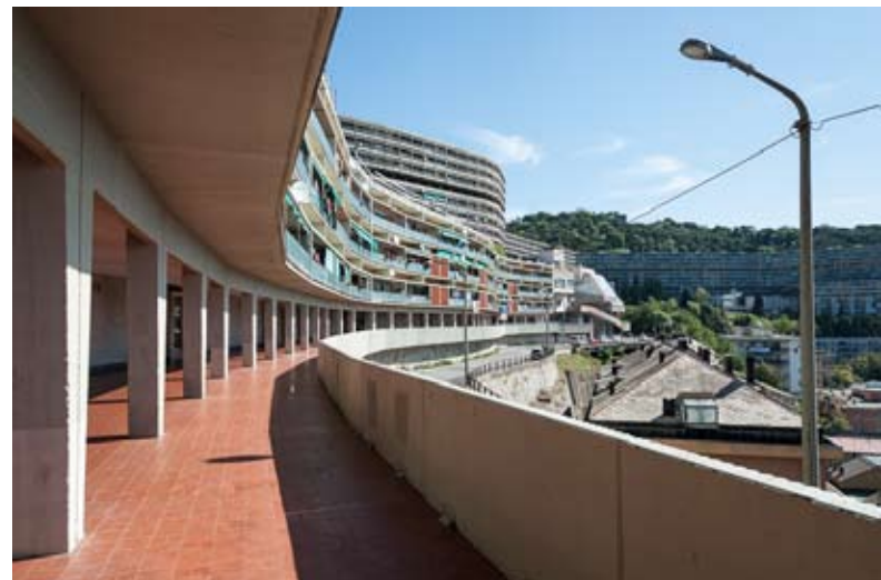
Figg. 8, 8a, 8b: Il "Biscione" – Quartiere INA-Casa di Forte Quezzi, foto di Jacqueline Poggi (© Jacqueline Poggi)

essere undici) che si sviluppa senza soluzione di continuità per 540 metri di lunghezza; al terzo piano, una rue intérieure attraversa la struttura da parte a parte, formando una terrazza panoramica continua che, nelle intenzioni del progettista, avrebbe dovuto costituire una moderna promenade architeturale. Tale soluzione si ritrova nel "Blocco D", anch'esso a sei piani, mentre i blocchi "B", "C" ed "E" si elevano per soli tre piani. Anticipando quello che sarebbe stato il destino delle "Dighe", delle "Lavatrici" e di tutti gli