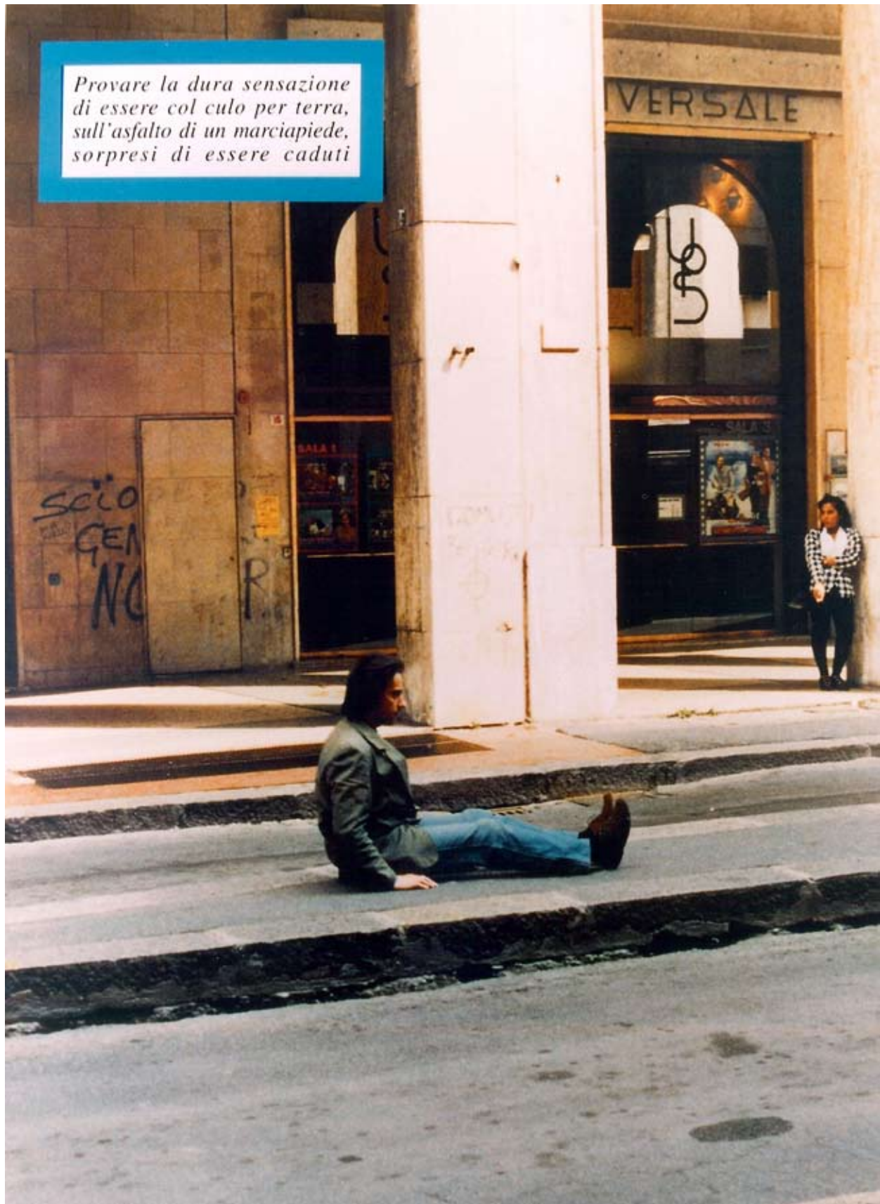
Fig. 1: Provare , 1995, stampa fotografica su alluminio, cm 120x90