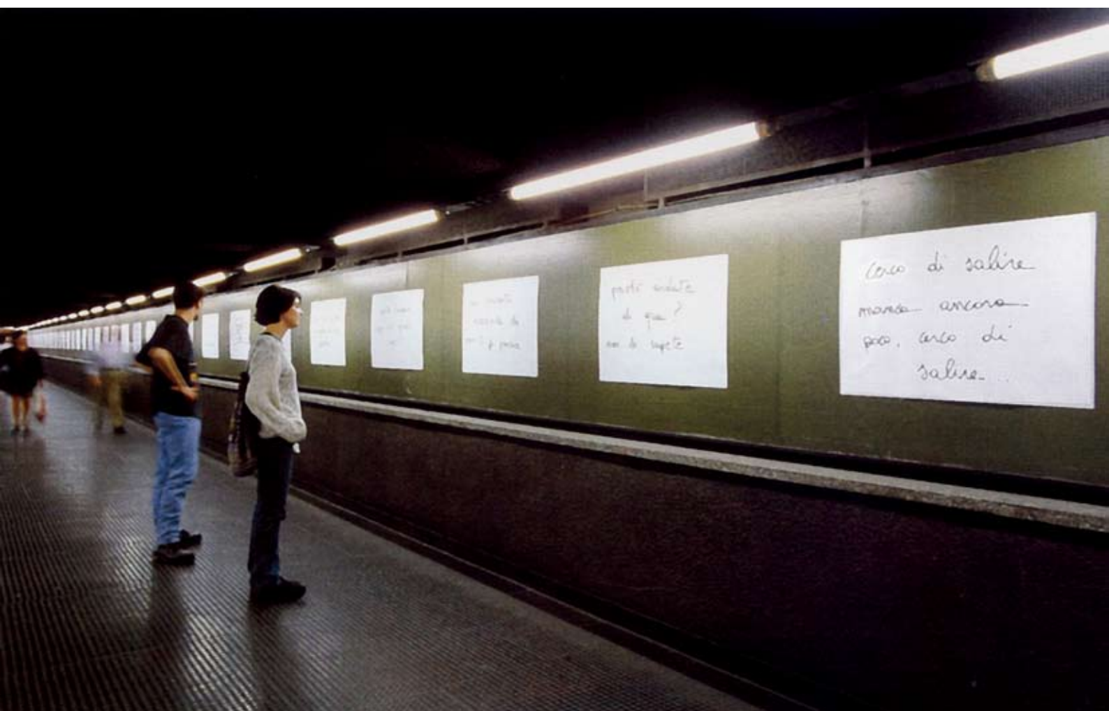
Fig. 2: Passaggi qui dal sottoterra , 1998, installazione, Milano, metropolitana, courtesy Galleria Pinksummer Genova

Fraasi del genere, lavorate dalla mente e dal mio processo di scrittura e di immaginazione, possono trasformarsi in veri e propri lavori, installazioni ambientali, progetti performativi, o spunti ulteriori per immagini, foto, disegni. Le idee che funzionano vengono fuori quasi per caso, mentre stai andando da qualche altra parte. E resti lì annichilito, stordito, mentre attraversi la strada. È una misteriosa questione di energia, e viene quando vuole, mai su ordinazione. Puoi restare settimane intere in ascolto, concentrato, a sforzarti, in cerca di soluzioni appropriate, ma niente. Solo un sordo vuoto, il precipizio nel nulla. Poi, finalmente, qualcosa di giusto spunta, senza chiedere il permesso. Ed è finalmente la cosa, il senso, la direzione che cercavi. Cerco sempre di realizzare dei lavori in cui ognuno possa costruirsi le immagini che desidera, piuttosto che imporre solamente io delle immagini prestabilite. L'artista deve funzionare come un mediatore, un trampolino, un dispositivo d'attenzione, che ecciti nell'altro il suo desiderio di immaginazione, e di elaborazione della propria parziale percezione di realtà. In fondo è una questione di libertà, di responsabilità, di condivisione e di partecipazione emotiva, senza dominare e senza essere dominati da nessuno.