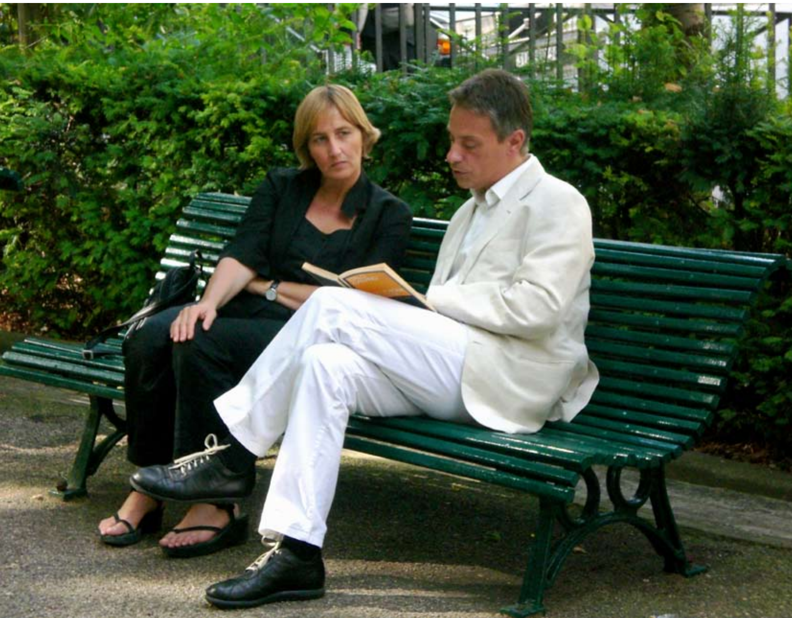
Fig. 5: Un appuntamento , 2007, performance, Parigi, Rue des École, angolo Rue Saint-Jacques

nano più per questo mondo così complesso, difficile, globalizzato. Non possiamo che avanzare risposte parziali, collocate, relative, contestualizzate al qui e ora.