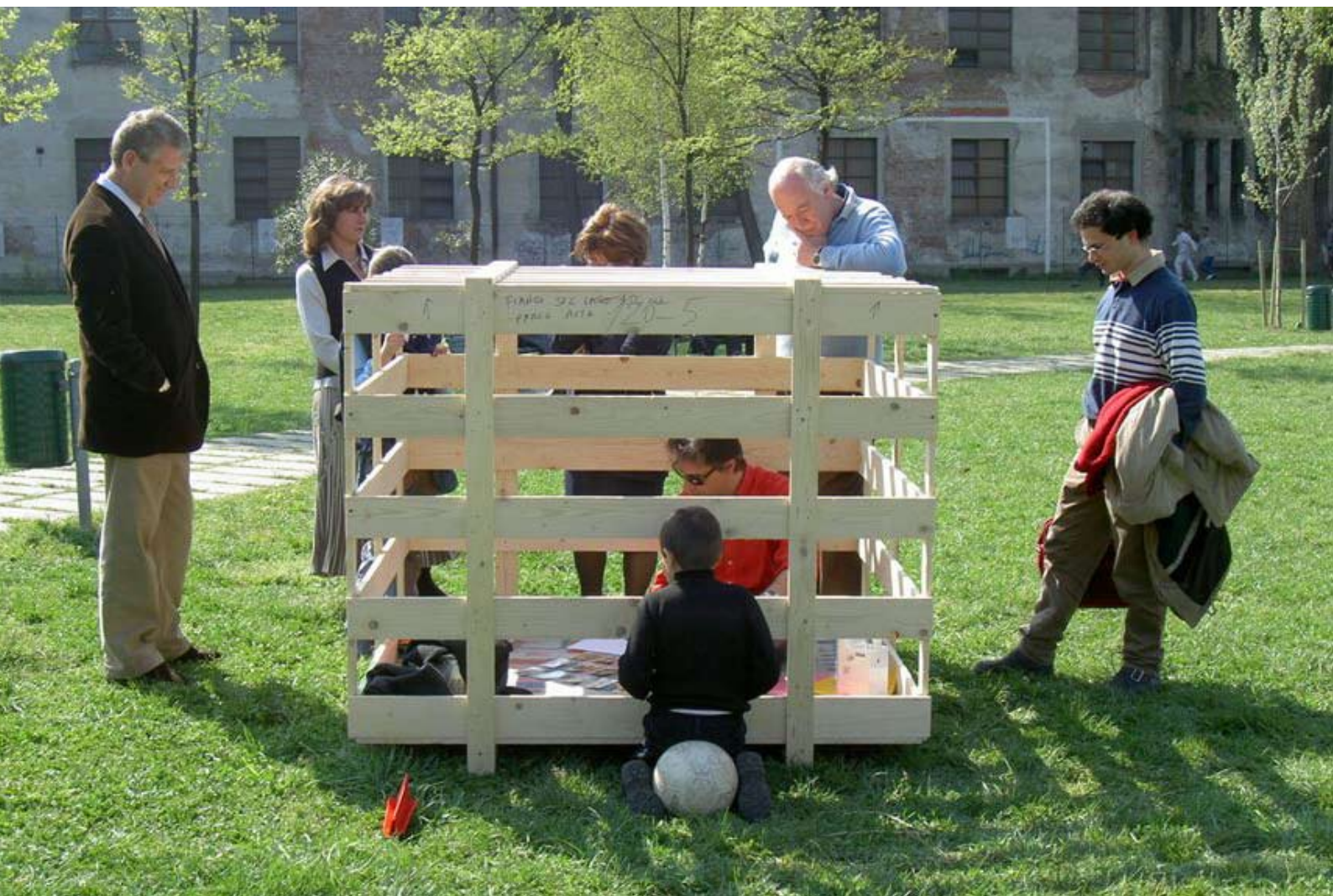
Fig. 3: Aladino è stato catturato , 2003, performance, Milano, Stecca degli Artigiani/Giardini dell'Isola, courtesy Galleria

In Italia questo è difficile, perché il nostro panorama culturale linguistico più riconosciuto e diffuso è caso mai quello letterario/narrativo e non tanto quello artistico, perché da sempre si intende l'arte come il regno del visibile.