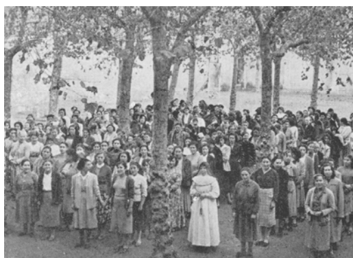
Formació general de preses al pati de les Corts. Memòria del PCNSM de 1953

En el seu extens hort, centenars de preses van ser explotades treballant en benefici de l'ordre religiosa, -sobretot durant els primers anys. Posteriorment, a principis dels anys cinquanta s'obriria un taller de costura que serviria a les preses com a mode de subsistència.