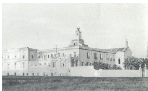
Presó de Les Corts. Arxiu Maria Barceló i Mas

A mitjans de 1939 hi havia prop de dues mil recluses, -amb més de quaranta nens-, tancades en aquesta institució. Onze preses polítiques van ser afusellades entre 1939 i 1940 al Camp de la Bota.