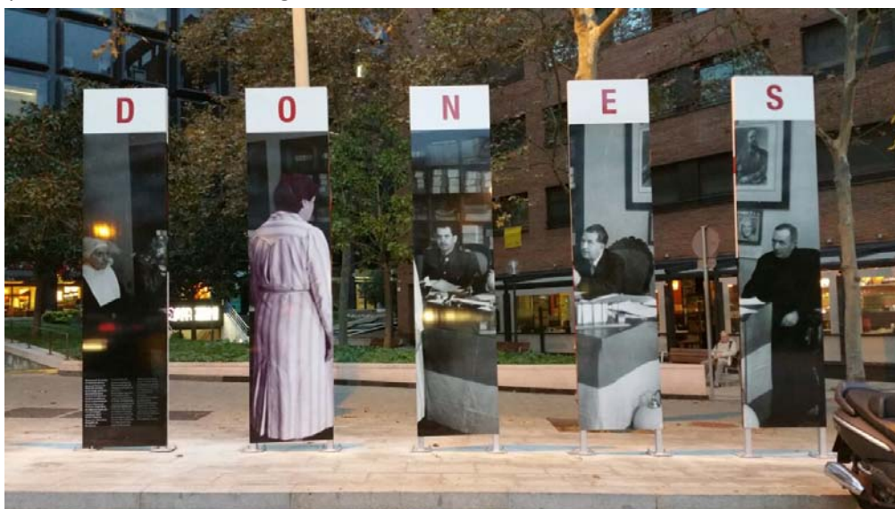
Espai de Memòria DONES/PRESÓ. Vista exterior des de l'espai vial

superiors de l'ordre de les Filles de la Caritat, encarregades de la vigilància penitenciària durant el règim.