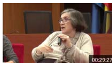
Taula B: Les entitats i els processos participatius, una presó invisible per a una memòria social compartida català | 3 des. 2014