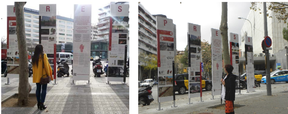
Exposició dels projectes del Màster de Disseny Urbà a l'Espai de Memòria DONES/PRESÓ. 25/11/2014 – 6/3/2015

2014 i fins al 6 de Març de 2015, la part expositiva de l'espai es dedica al conjunt dels 7 projectes dels estudiants del Màster de Disseny Urbà (UB).