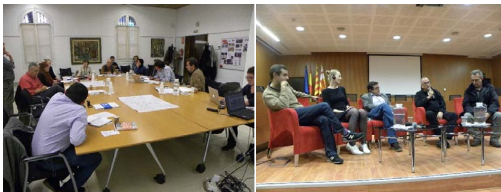
Discussió durant una de les sessions del Workshop i Taula C: Art, memòria i espai públic, una perspectiva europea i internacional. 26/11/2015

Les Jornades s'articulen en forma de workshop durant els matins, i taules rodones i conferències públiques durant les tardes. Les sessions serveixen per debatre sobre la capacitat de l'art contemporani per socialitzar la memòria col·lectiva i la dignificació de les víctimes, apostant per una forma transversal i col·lectiva de reflexió entorn a la creació d'espais públics de memòria. Una de les presentacions amb més impacte durant les Jornades és la representació teatral "Les Veus de Les Corts", de Memòria Silenciada. En l'obra, els testimonis de les dones són la cadena de transmissió de la realitat viscuda: el patiment, la injustícia, però també l'expressió de la resistència.