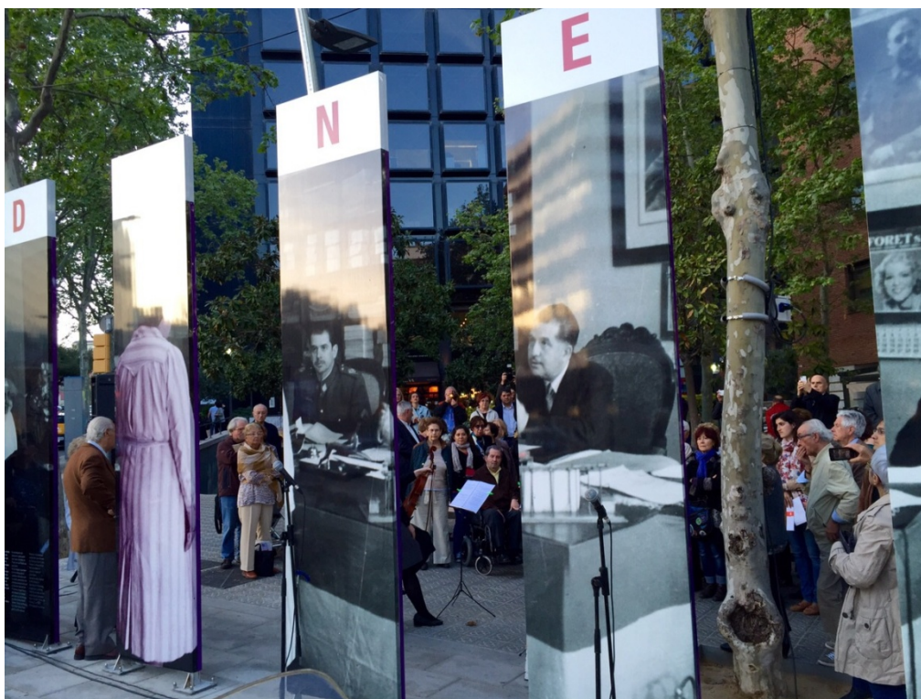
Acte d'homenatge a les preses, -i als fills i filles-, repressaliades a la Presó de Les Corts.

El conjunt del procés és reconegut amb la Medalla d'Honor de Barcelona l'any 2015. Falta però encara molt camí per fer. Volem reivindicar en l'espai urbà la construcció d'un monument definitiu. De moment però treballem per a l'apropiació i dinamització de l'Espai de Memòria de la presó; i per aquesta raó, el dia 14 d'Abril de 2015, data de celebració de la proclamació de la República espanyola, s'organitza un acte d'homenatge a les dones, -i als seus fills i filles-, repressaliades en aquesta institució.