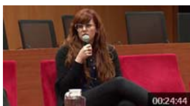
Taula A: Exemples internacionals. Valentina Rozas castellà | 3 des. 2014

Per una part, es valora positivament l'Espai de Memòria DONES/ PRESÓ, per la visibilitat atorgada al procés de participació. En aquest sentit es valora convertir aquest emplaçament en el lloc d'expressió pública del propi procés. Es destaca com imprescindible seguir potenciant la socialització de la memòria per a la construcció del futur monument i per tant es proposa la dinamització de l'espai amb esdeveniments singulars que ajudin a la difusió del que va ser la presó, i a l'apropiació del lloc per part de la ciutadania, especialment dels més joves. En aquest sentit es proposa l'establiment d'un dia simbòlic anual de commemoració i trobada.