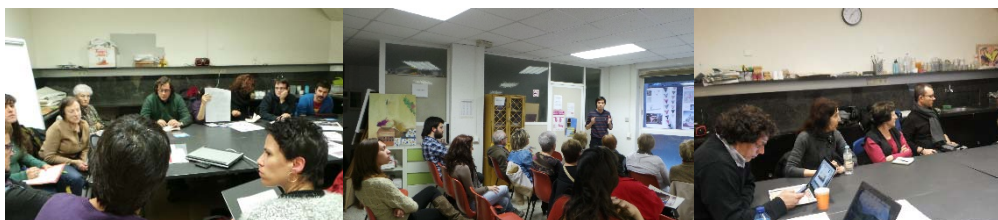
Centre Cívic Can Deu. 20/11/2013

La memòria invisible de les dones repressaliades constitueix un deute de la ciutat de Barcelona envers el reconeixement de la seva història. És la societat civil la que inicia el procés de recuperació d'aquesta memòria escapçada: familiars d'expresses, entitats i associacions de dins i fora del districte com les Dones del 36, grups de recerca de l'àmbit acadèmic,...ciutadans i ciutadanes immersos en un procés obert i col·laboratiu, que ha servit per restituir una part de la memòria col·lectiva de la ciutat i que ha resultat en exposicions, taules rodones, obres de teatre, publicacions i l'establiment d'un espai memorial desenvolupat per l' Associació per la Cultura i la Memòria de Catalunya (ACME) i allotjat a presodelescorts.org .