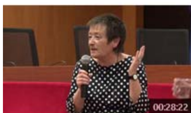
Dones, monumentalitat i espai públic. Les Corts, Barcelona. Isabel Segura català | 3 des. 2014