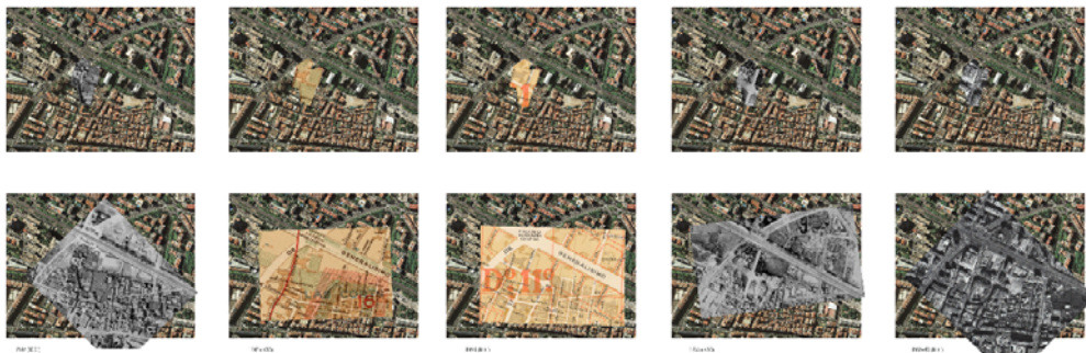
Fotomuntatges d'ortofotomapes (1945; 1966; 1985) i plans urbanístics (1958) del territori. Estudi per a la comprensió de l'evolució de l'entorn construït i el perímetre de la presó