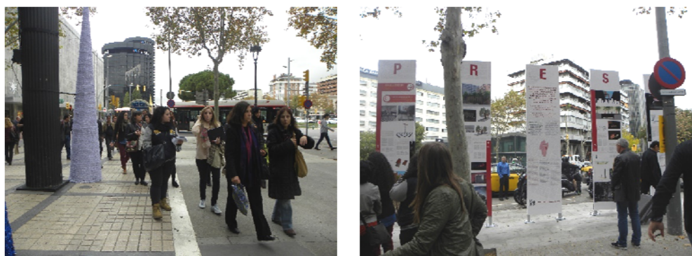
Ruta per l'antic perímetre i finalització a l'Espai de Memòria DONES/PRESÓ. 25/11/2014

El grup d'experts es configura a partir de les Jornades com a consell tècnic i artístic assessor del procés. En paral·lel s'organitza l'exposició del projectes del Màster de Disseny Urbà (UB) en un espai expositiu públic creat ex professo per a l'ocasió, en un dels xamfrans de la cruïlla dels carrers Joan Güell amb Europa. El disseny d'aquesta exposició temporal es converteix en el disseny de l' Espai de Memòria DONES/PRESÓ , espai provisional construït a l'espera d'un monument definitiu.