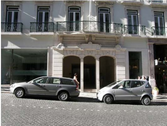
12 – Espaço ocupado pelo Café “Chiado”

O café Chiado, inaugurado em 1925 e hoje desaparecido, ocupava os números 62 a 56 na mesma rua 30 . Descrito como um espaço particularmente agradável, viria a ser encerrado em 1963. Até essa data foi um dos locais preferidos dos alunos da E(S)BAL e das gerações mais jovens que ali se reuniam e debatiam os temas do momento. O seu espaço, radicalmente transformado, é agora a entrada para um parque de estacionamento subterrâneo [Fig.12,13].