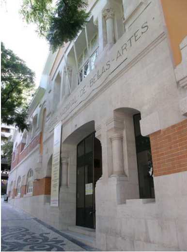
6) Entrada da SNBA Sociedade Nacional de Belas Artes

Dada a escassez de contextos expositivos, os salões da SNBA foram espaços de visibilidade de grande importância, onde os arquitectos, em particular, se punham a par da produção artística contemporânea.