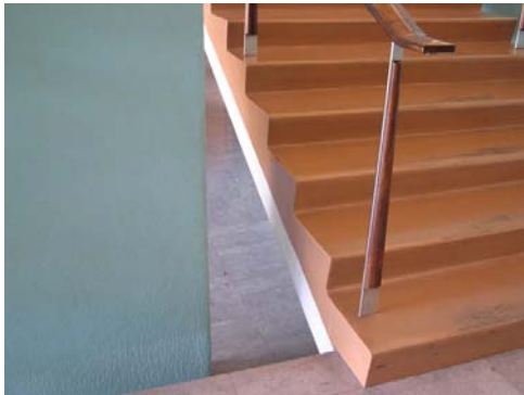
2) Estudo de policromia de Frederico George no Bloco das Águas Livres [1955/1956, arquitectos Nuno Teotónio Pereira e Bartolomeu da Costa Cabral]

Esta ideia, que ficou conhecida como síntese ou integração das artes 1 , tinha como exemplo recente a arquitectura brasileira que, partindo dos pontos de doutrina do movimento moderno propostos por Le Corbusier, surpreendera o mundo com um enorme arrojo formal e com