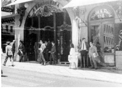
11) Café “A Brasileira”.

Os dois cafés da rua Garrett eram a Brasileira do Chiado e o Café Chiado. A Brasileira do Chiado, que sobrevive hoje como local turístico, tinha sido fundada em 1905. Local sempre frequentado por artistas, exibiam-se nas suas paredes várias telas de pintores da “primeira geração modernista”, desde 1925 29 . Nos anos do pós-guerra, com quase cinquenta anos de história, a Brasileira era o “templo dos mestres”, onde se encontravam elementos pertencentes a gerações anteriores [figs.10,11].