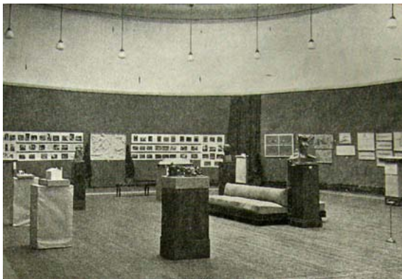
7) Aspecto da 2ª Exposição Geral de Artes Plásticas em 1947.

No primeiro ano do pós-guerra a oposição rejubilava, confiante no fim próximo do regime. Em 1946 um grupo de artistas e arquitectos, muitos deles pertencentes ao MUD – Movimento de Unidade Democrática 23 – organizam uma mostra conjunta no espaço da SNBA. Era a primeira de dez Exposições Gerais de Artes Plásticas – ou simplesmente “Gerais”, como passaram a ser designadas – que se realizaram até 1956 [figs.7,8].