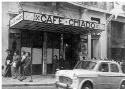
13 –Café “Chiado”.

interesses afins que neles cimentavam verdadeiras redes sociais.