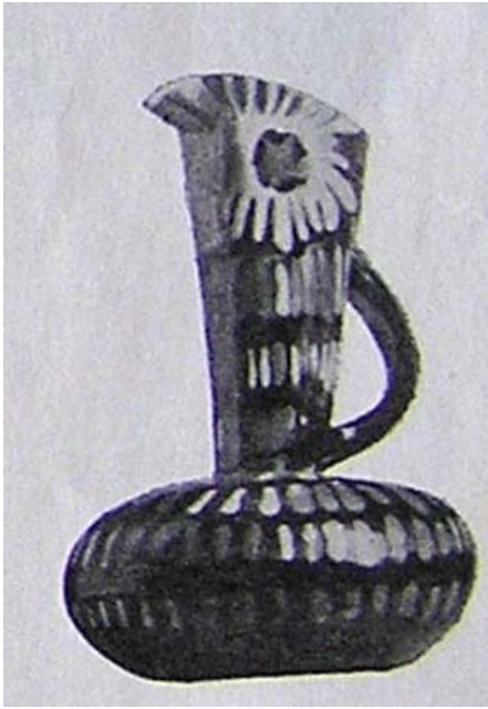
9) Jarro concebido por Vítor Palla.