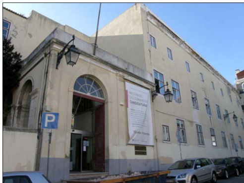
5) Entrada da antiga E(S)BAL [Convento de S. Francisco], onde funciona actualmente a Faculdade de Belas Artes da Universidade de Lisboa.

chamado “desenho de estátua” – o desenho de observação de cópias da escultura e de elementos arquitectónicos das ordens clássicas – mas também as disciplinas de geometria descritiva e, depois de 1957, de história da arte 14 .