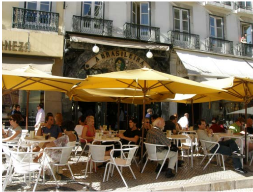
10) Café “A Brasileira”

se concentravam, além da E(S)BAL, importantes instituições, como a ANBA – Academia Nacional de Belas Artes; os teatros de S. Carlos e de S. Luís e o Conservatório de Música, bem como várias livrarias que desempenhavam também um papel relevante no domínio cultural e na oposição ao regime.