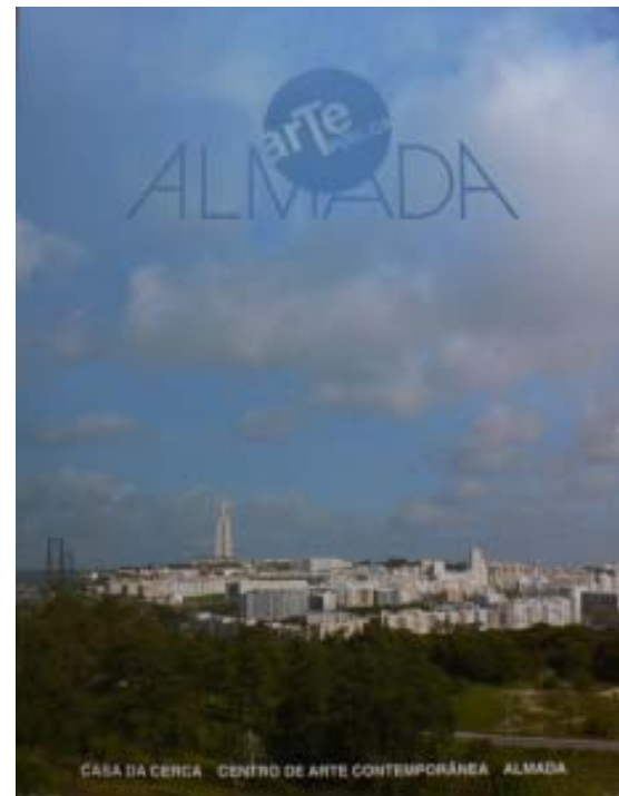
POC. Programa Operacional da Cultura (Portugal)

Neste momento apresentámos uma candidatura ao Programa de financiamento do POC para a digitalização do inventário e conclusão das fichas no que diz respeito à recolha de imagens fixas e animadas, financiamento esse que viabilizará também fundos para pagamento aos comentadores, à tradução das fichas e, sobretudo, à