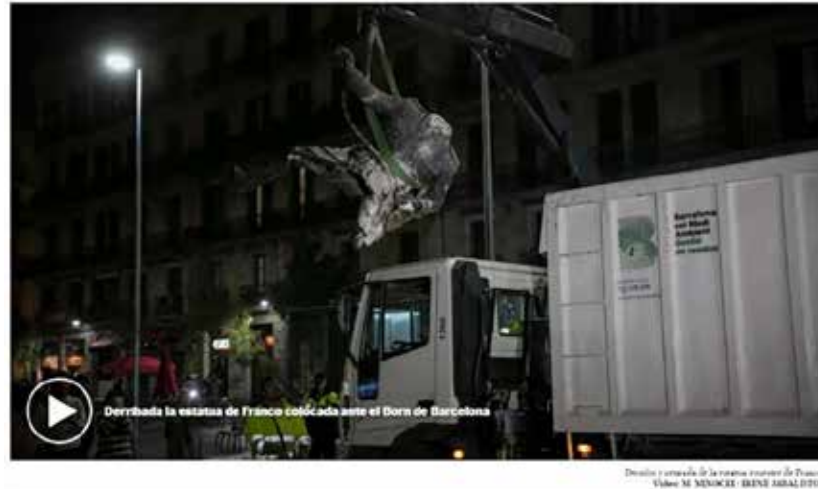
Figura 1. Escultura ecuestre de Franco vandalizada. A la izquierda (1A) fotografía y titular de la decapitación de la estatua ecuestre de franco, expuesta en el Born de Barcelona en 2016. A la izquierda (1B), fotografía y titular del derribo posterior de esta misma estatua y de su retirada. (Publicado en El Mundo (18/10/2016 y 20/10/2016 respectivamente)

El Ayuntamiento de Barcelona ha retirado los trozos del monumento esta madrugada