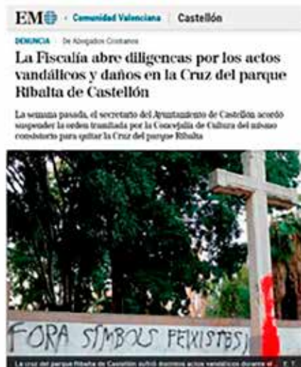
La Cruz del parque Ribalta de Castellón sufrió diversos actos vandálicos durante el...

Europa Press 12 de octubre de 2020 - 21:38h