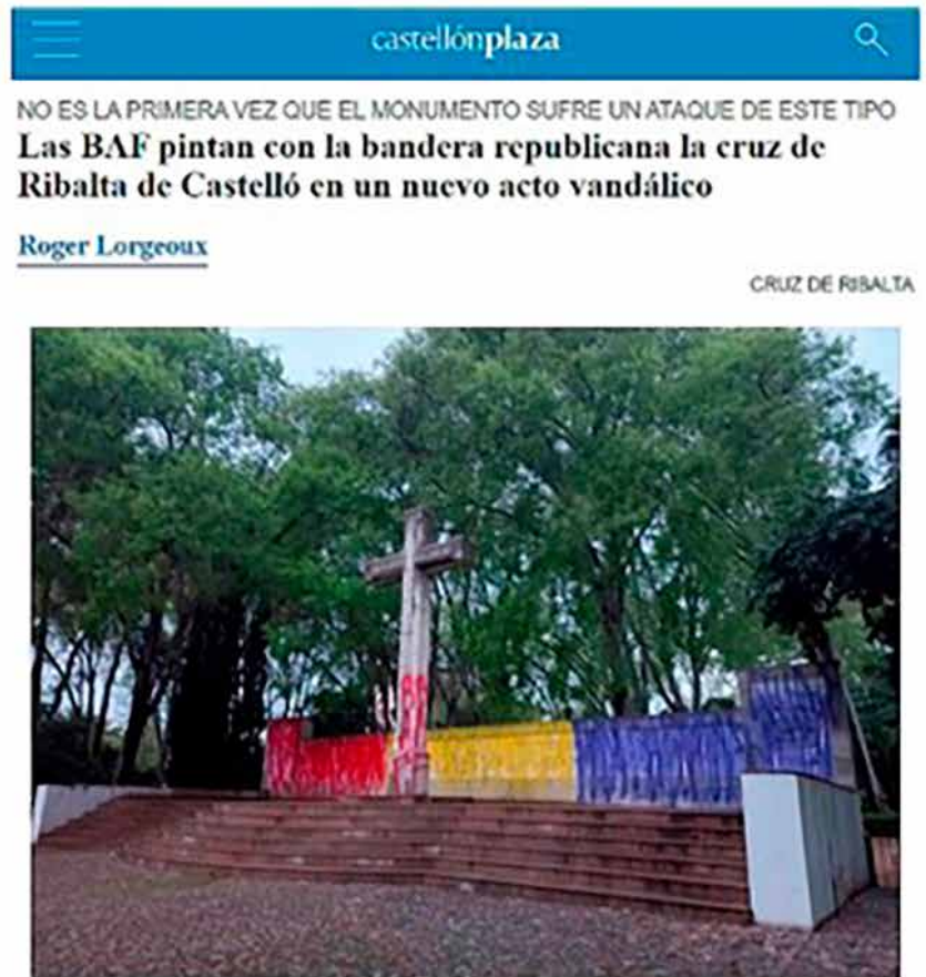
Figura 2. Actos de vandalismo con pintada de banderas. A la izquierda (2A), fotografía y titular de un monumento a los represaliados del franquismo vandalizado con una bandera de España. A la derecha (2B), una Cruz a los Caídos levantada durante el franquismo vandalizada con una bandera republicana. (Referencia completa en el anexo 1)