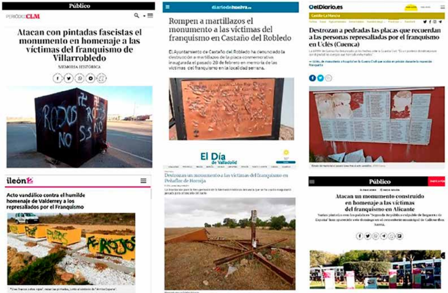
Figura 5. Composición de imágenes de ataques vandálicos (golpes, pintadas, destrozos) a monumentos que homenajean el recuerdo a las víctimas del franquismo (Referencia completa en el anexo 1).

El monumento franquista del Ebro ya no es considerado Bien Integral del Patrimonio Cultural Catalán. La Comisión de Urbanismo de "Les Terres de l'Ebre" (CUTE) ha aprobado definitivamente este lunes la modificación del planeamiento urbanístico de Tortosa (Baix Ebre) para descatalogar el monumento de la Batalla del Ebro, situado en el río Ebro. (ACN, 2020)