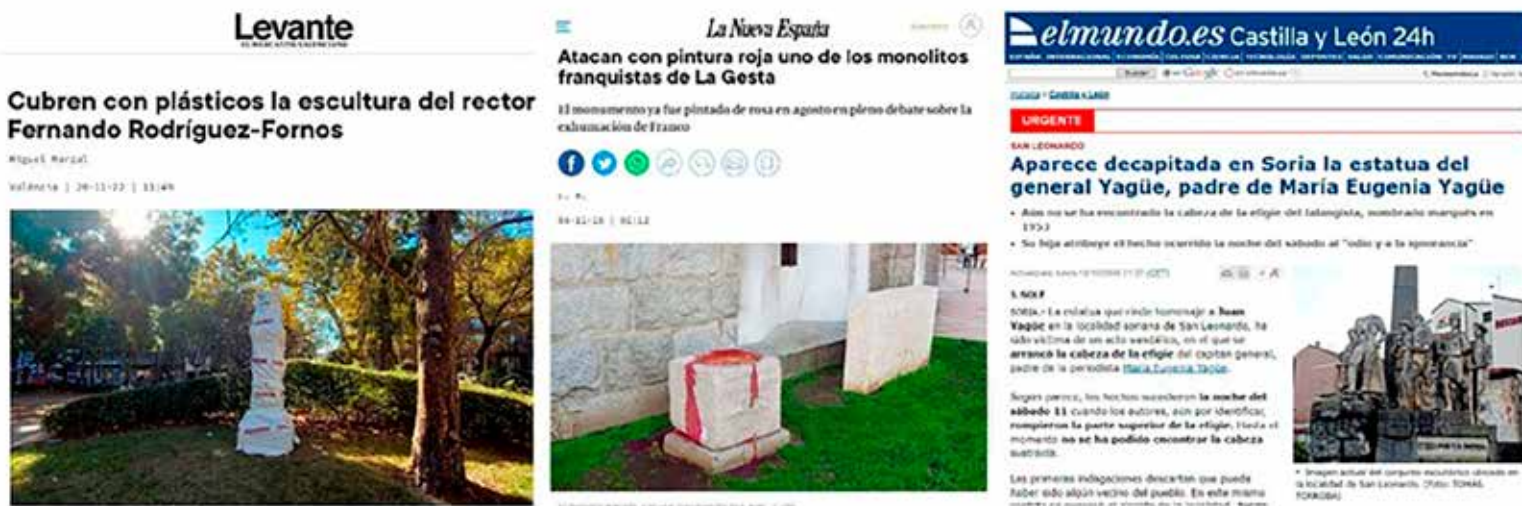
Figura 6. Composición de imágenes de prensa que muestran ataques a vestigios del franquismo. De izquierda a derecha: 6A, tapado con plásticos de una escultura franquista; 6B, vertido de pintura roja sobre un monolito franquista y 6C, decapitación de una estatua del General Yagüe. (Referencia completa en el anexo 1)