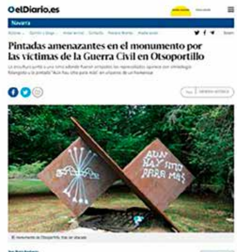
El monumento de Otsoportillo fue vandalizado...