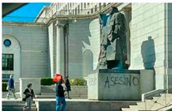
Vandalizan la estatua de Indalecio Prieto con pintadas de 'asesino'

Europa Press 12 de octubre de 2020 - 21:38h